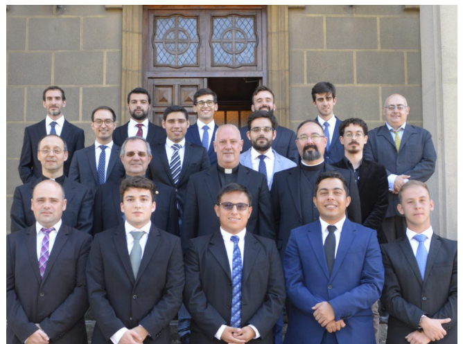
Los nuevos seminaristas con el rector, arriba, y foto de grupo del Seminario.