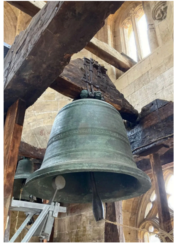
La Wamba, la campana en uso más antigua.