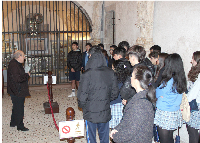
Un grupo de escolares visitando la Cámara Santa.

Sí, la actividad se centra aquí en Oviedo, porque nos da la posibilidad de que tengan acceso a muchos lugares diversos, y