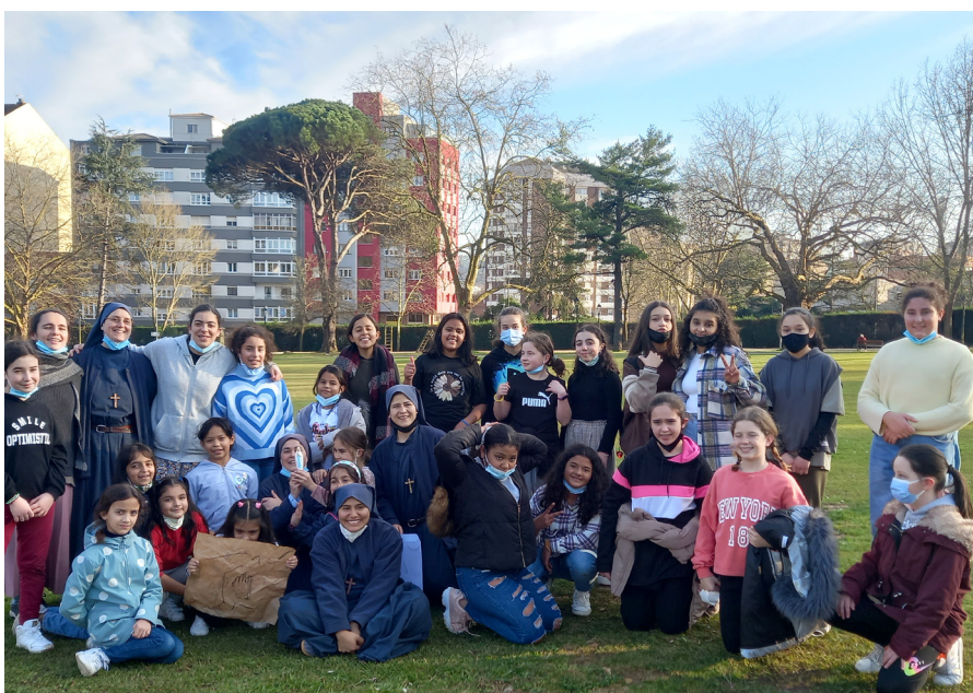
Religiosas Siervas del Hogar de la Madre junto a un grupo de jóvenes de la parroquia de San Nicolás de Bari.

na Clare, que nos está enviando muchísimas vocaciones, en un momento en el que, desgraciadamente, vemos cómo cierran muchos monasterios y la edad media de los religiosos es muy alta”.