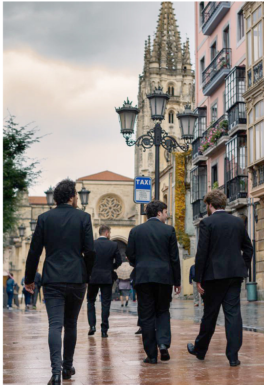
Ensemble coral In Paradisum