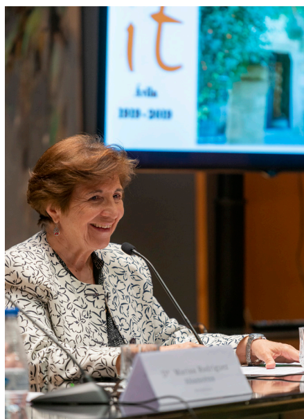
Camino Cañón Loyes.

Sí, estuvo desde 1906 hasta 1913. Él siempre decía que siete años en este lugar dan mucho de sí, y él durante esos años por supuesto cumplió con sus deberes como canónigo, atendió a los peregrinos, etc. Pero además, venía de Guadix, de tocar una realidad muy pobre, y se daba cuenta de que cualquier proceso de reconstrucción de la dignidad de esas personas pasa-