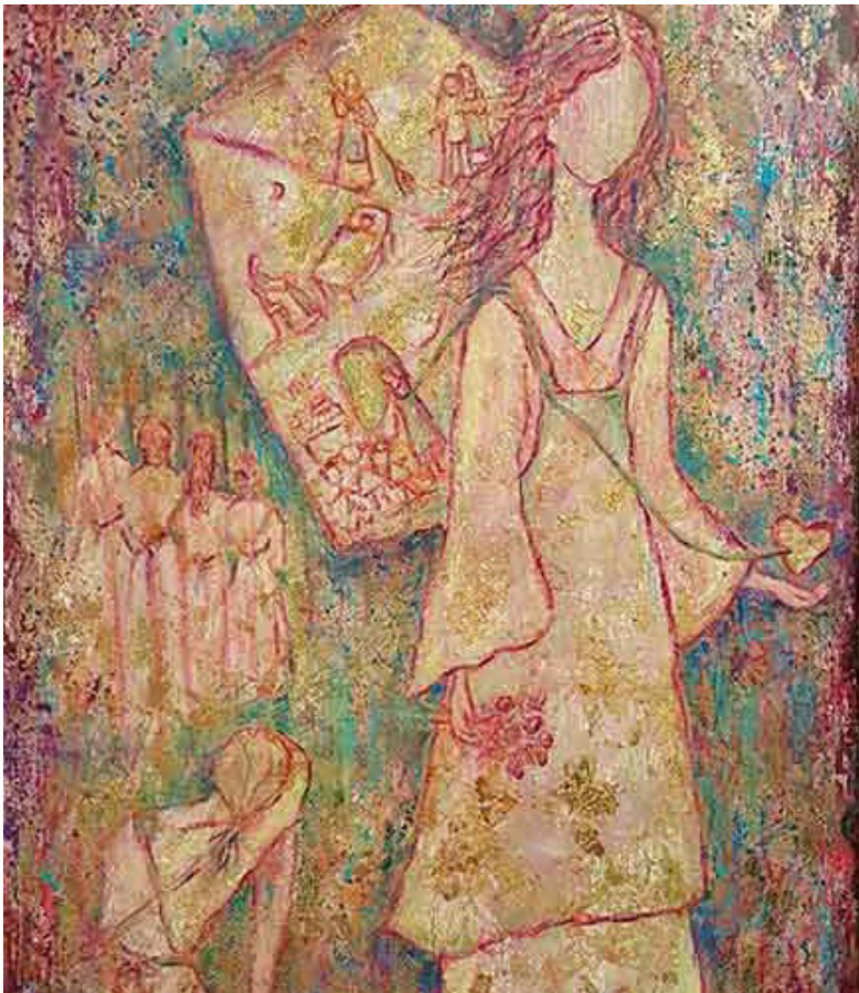
Cartel de la Jornada Mundial de Oración y Reflexión contra la Trata 2021.