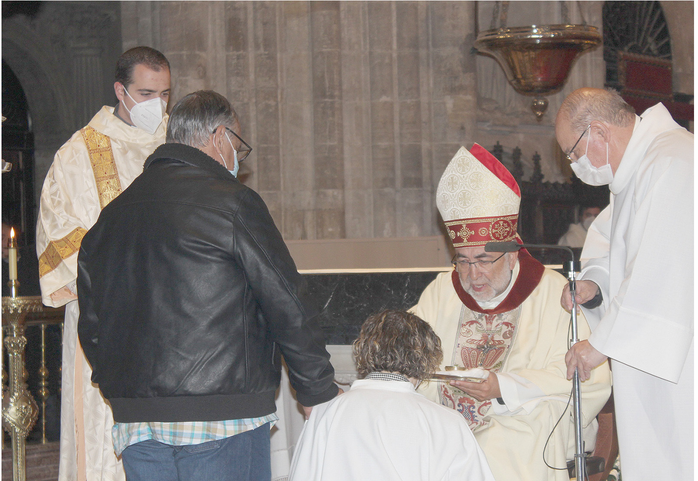
Celebración de los Sacramentos de Iniciación cristiana para adultos, el pasado mes de octubre en la Catedral de Oviedo.