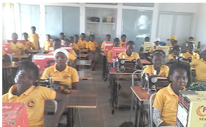
Estudiantes en el centro regentado por las Religiosas de María Inmaculada.

A pesar de las dificultades que este año está trayendo consigo, Manos Unidas Asturias continúa su labor para atender los proyectos previstos como el que se ha podido finalizar en el país africano de Burkina Faso, en un barrio marginal de su capital Ouagadougou, dotando al centro de formación Santa Vicenta María de Saaba, regentado por las Religiosas de María Inmaculada, de las instalaciones adecuadas para la alfabetización y capacitación profesional de mujeres. El proyecto ha supuesto una inversión de más de 92.000 € y ha hecho posible que en este curso se hayan podido inscribir sesenta chicas nuevas, por lo que actualmente noventa y cinco alumnas se está formando en él. Unos trabajos que se han podido desarrollar como estaba previsto a pesar del periodo de fuertes lluvias y de la dificultad de tener que avanzar mientras las alumnas ya matriculadas continuaban con sus estudios ya que se quiso comenzar lo antes posible para que este curso se pudiese dar la oportunidad a otras jóvenes de comenzar su formación. El hecho de que las religiosas vivan allí, aunque su casa de comunidad no está aún construida se han instalado en unas habitaciones para poder estar cerca de las obras, ha facilitado el seguimiento de los trabajos y la solución de las dificultades que se han ido planteando.