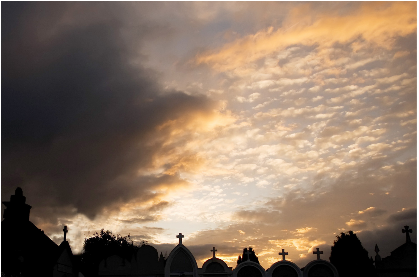
Cementerio de Puerto de Vega