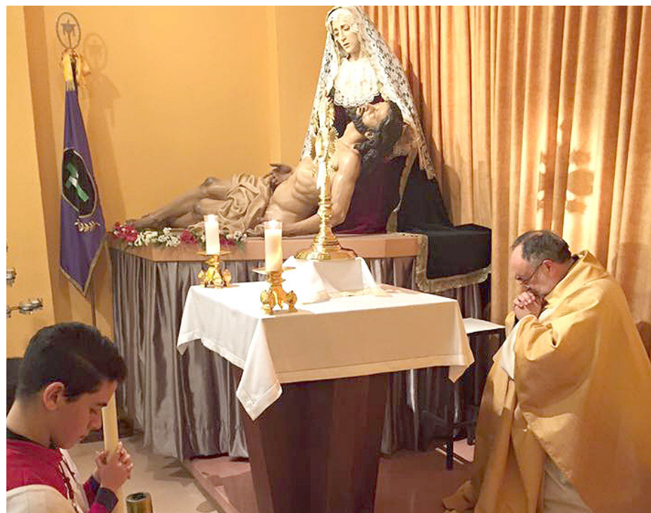
El Arzobispo de Oviedo, Mons. Jesús Sanz, en la inauguración de la capilla, el 19 de enero de 2015

“Animamos a la gente a que conozca la Adoración Perpetua. El Señor quiere que vayamos, y nos está esperando”