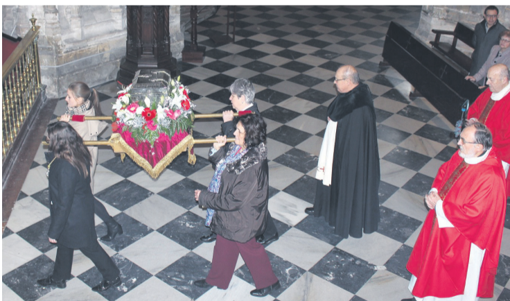
Un momento de la celebración.

Santa Eulalia nació en Mérida en el siglo III y fue martirizada cuando solo era una niña de trece