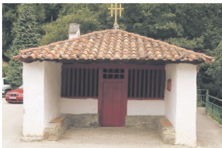
Capilla de Santiso.