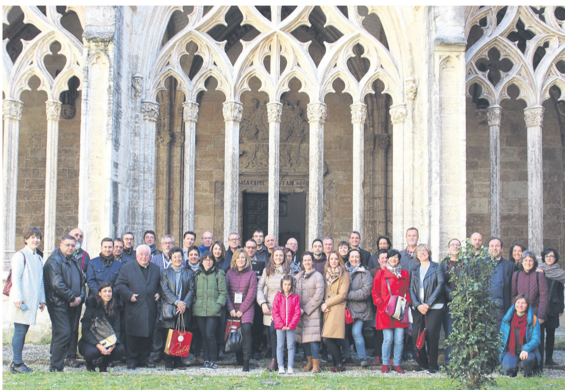
Participantes de las Jornadas Técnicas de Bibliotecarios de la Iglesia, en la Catedral de Oviedo.