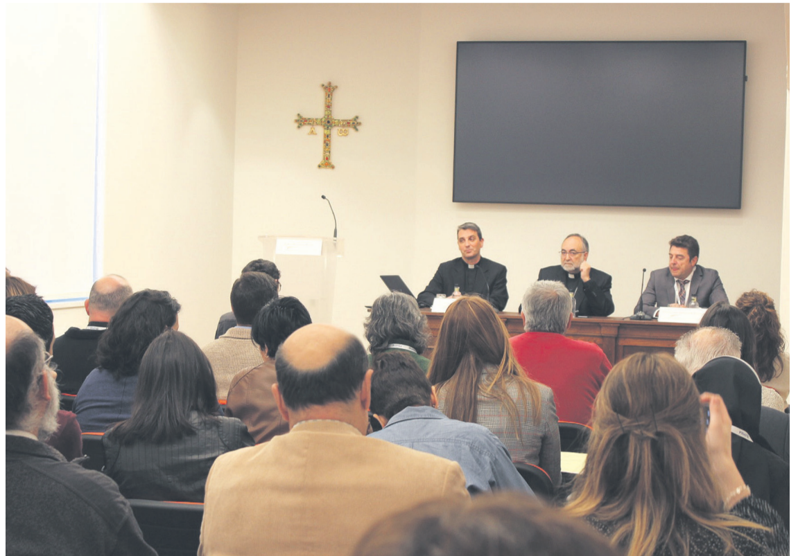
Sobre estas líneas, inauguración de las jornadas en el Seminario de Oviedo. A la izquierda, incunables en el archivo de la Catedral.