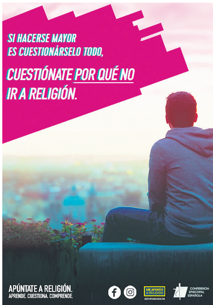
Uno de los carteles de la campaña de www.meapuntoareligion.com.