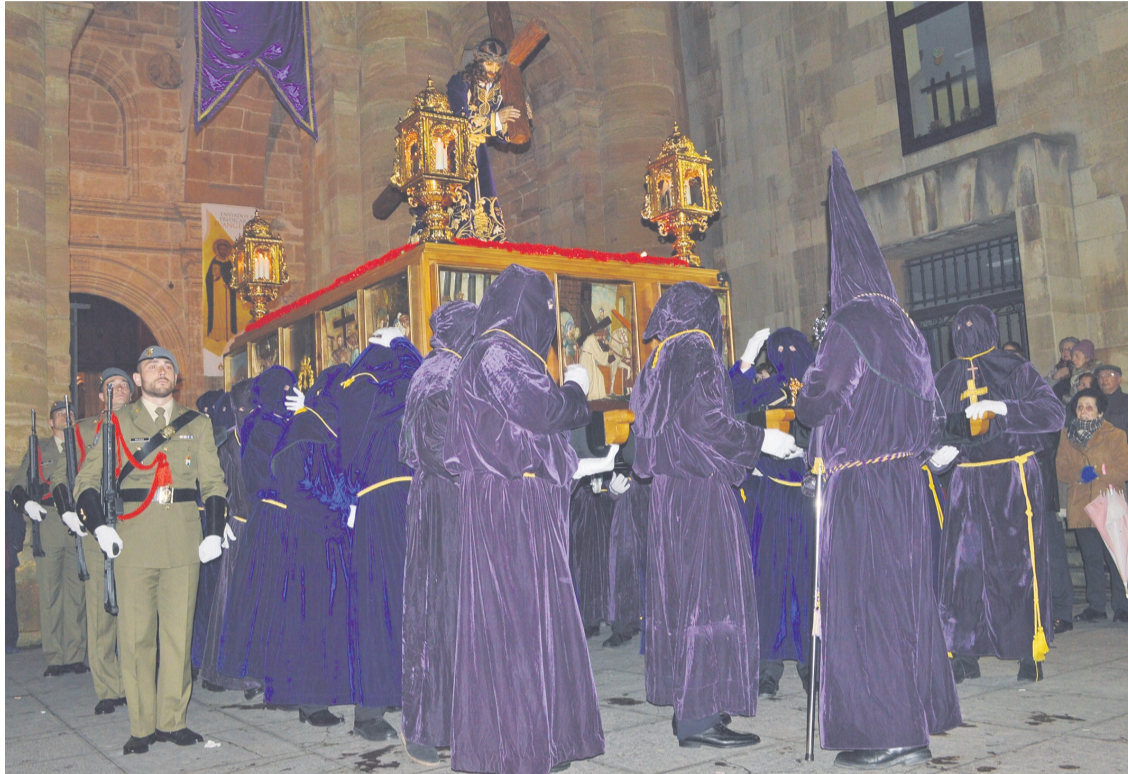
Un momento de la procesión del Nazareno el Miércoles Santo.

En este sentido, en abril se presentará un nuevo trono que se está realizando a partir del antiguo a ruedas y el Miércoles Santo se vivirá un momento muy significativo