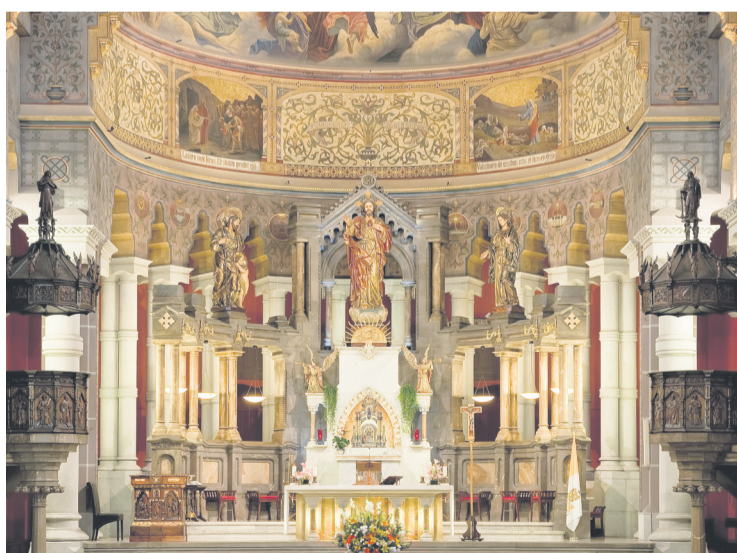
Interior de la Basílica del Sagrado Corazón de Gijón.