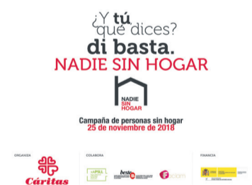
Cartel de la campaña de este año.

piso en Blimea. El objetivo final es capacitar a la familia para que logre el acceso a un alojamiento estable y