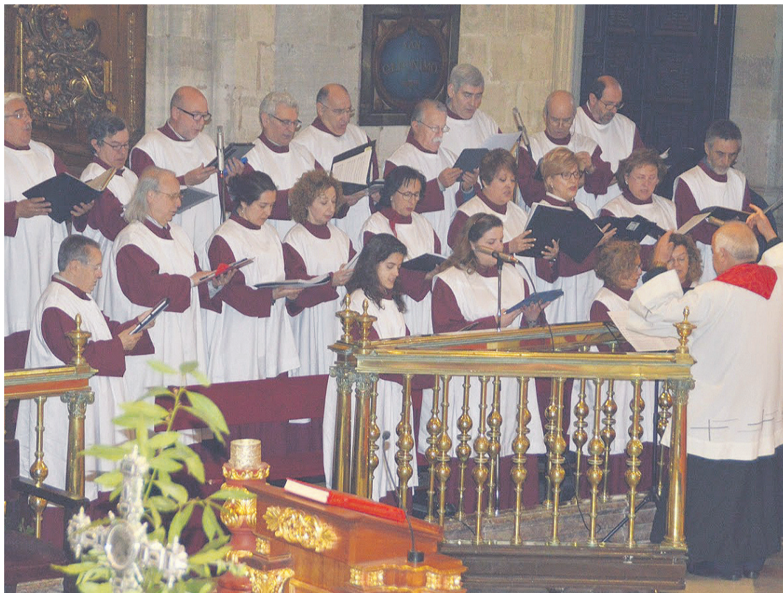
La Schola Cantorum, en la Catedral de Oviedo.