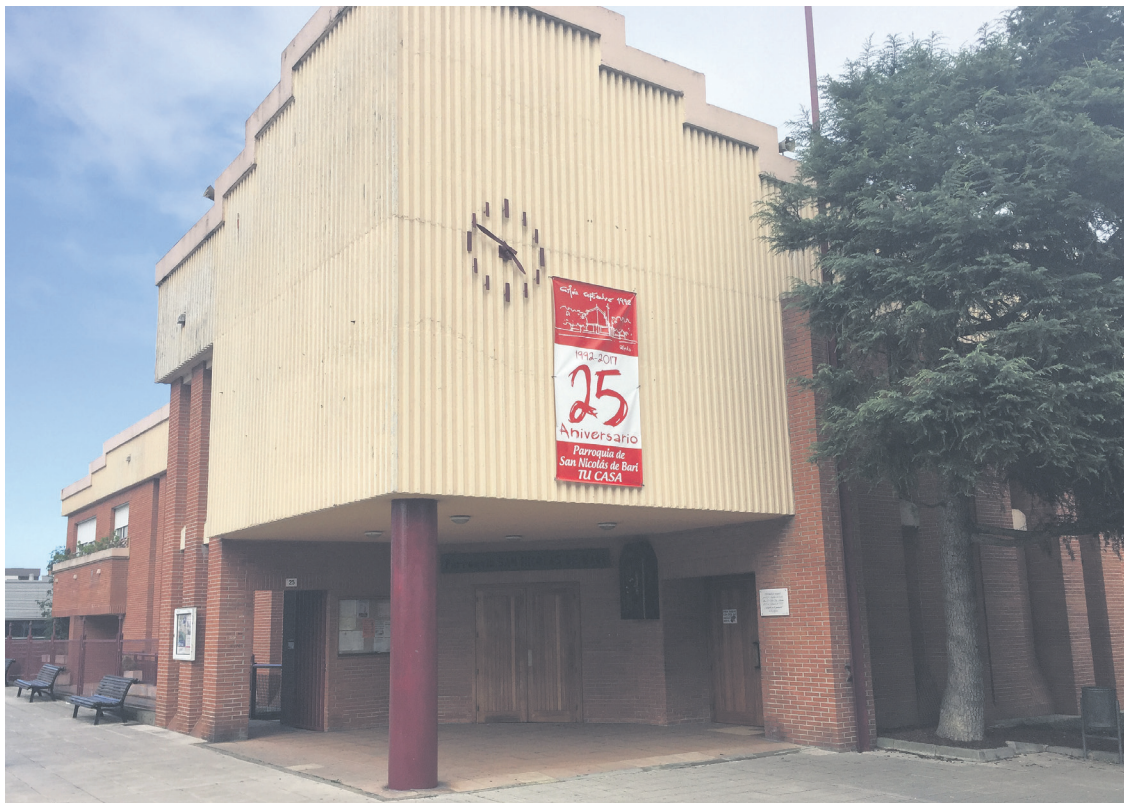
Fachada de la parroquia de San Nicolás, en El Coto (Gijón).