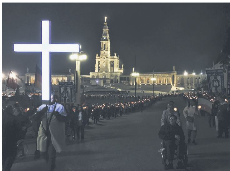
Procesión de las antorchas en el Santuario de Fátima (Portugal).

del Apostolado Mundial de Fátima, celebrará un acto religioso en la parroquia de San José de Gijón, que dará comienzo a las 19 horas, con el rezo del rosario, y a las 19,30 h. eucaristía. Un gesto que han repetido cada día 13 desde el pasado mes de mayo, recordando así cada una de las apariciones de la Virgen a los pastorcitos.