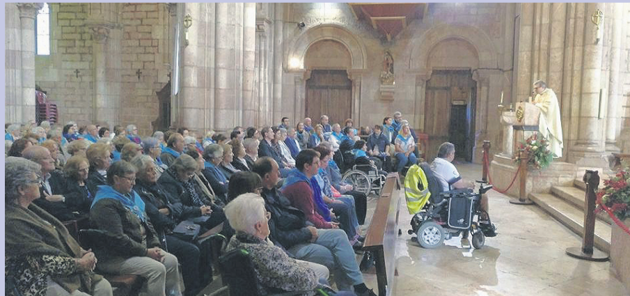
Un momento de la eucaristía en Covadonga con la Hospitalidad.