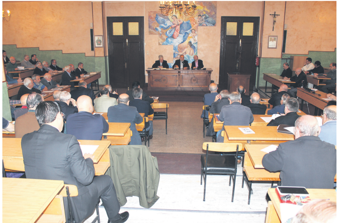
Un momento de la charla, en el Aula Magna del Seminario.

Se configura la centralización de servicios, al mismo tiempo que estos se reparten. Pongo algunos ejemplos. En nuestro caso lo