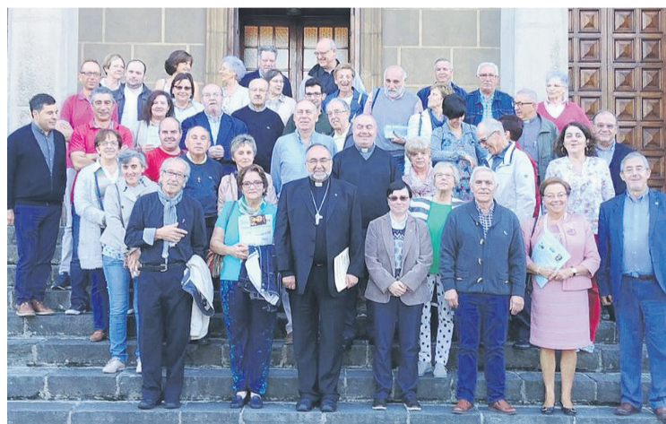
Encuentro en el Seminario de Consejos Arciprestales de Oviedo-Centro.

El objetivo del encuentro, además de conocerse, trabajar y orar en comunidad, era profundizar en el papel que deben tener los Consejos Pastorales en los Arciprestazgos, en este momento de inicio de curso en el que se están elaborando conjuntamente entre sacerdotes, laicos y consagrados la programación de las acciones pastorales