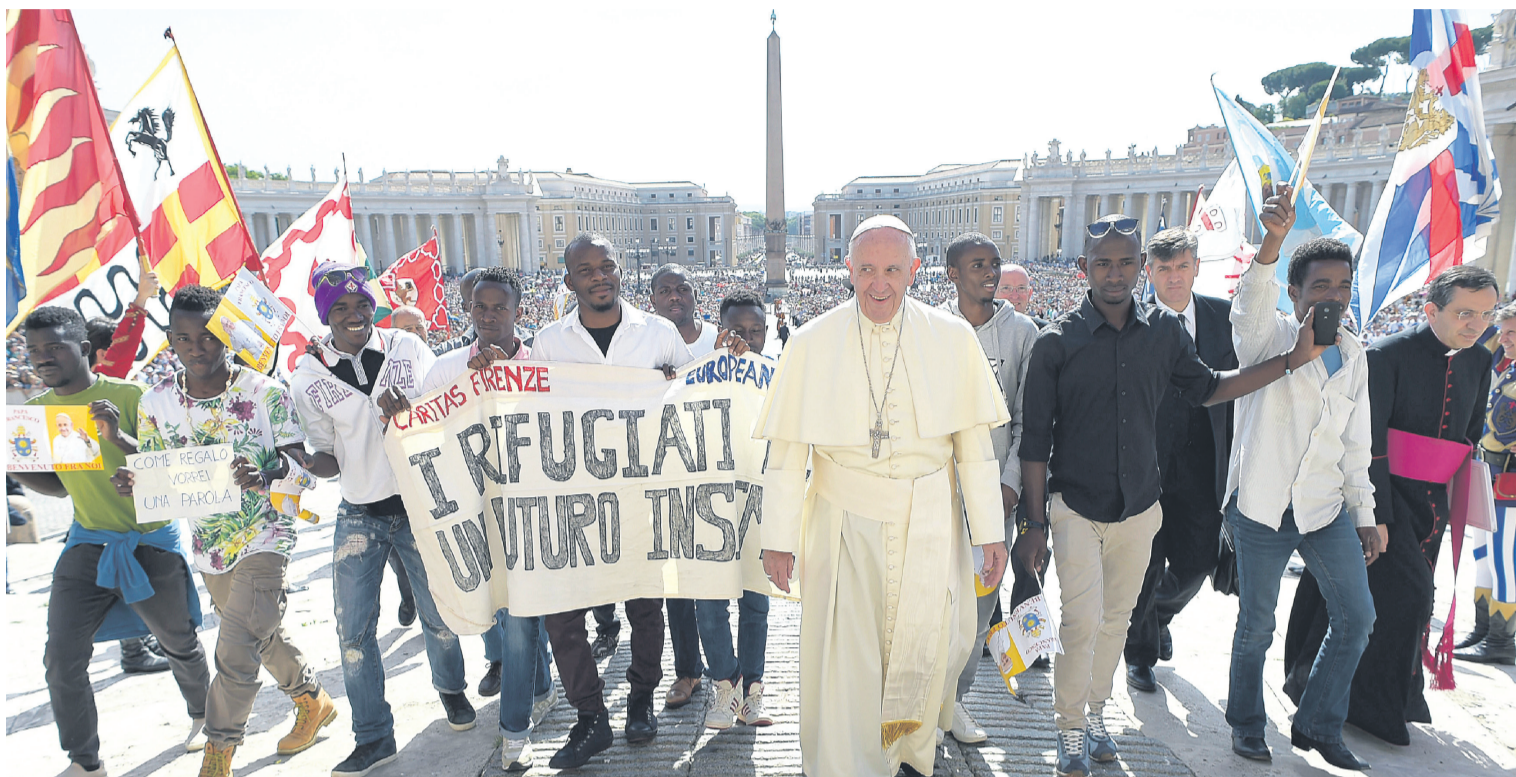
El Papa Francisco, con migrantes y refugiados, en el Vaticano.