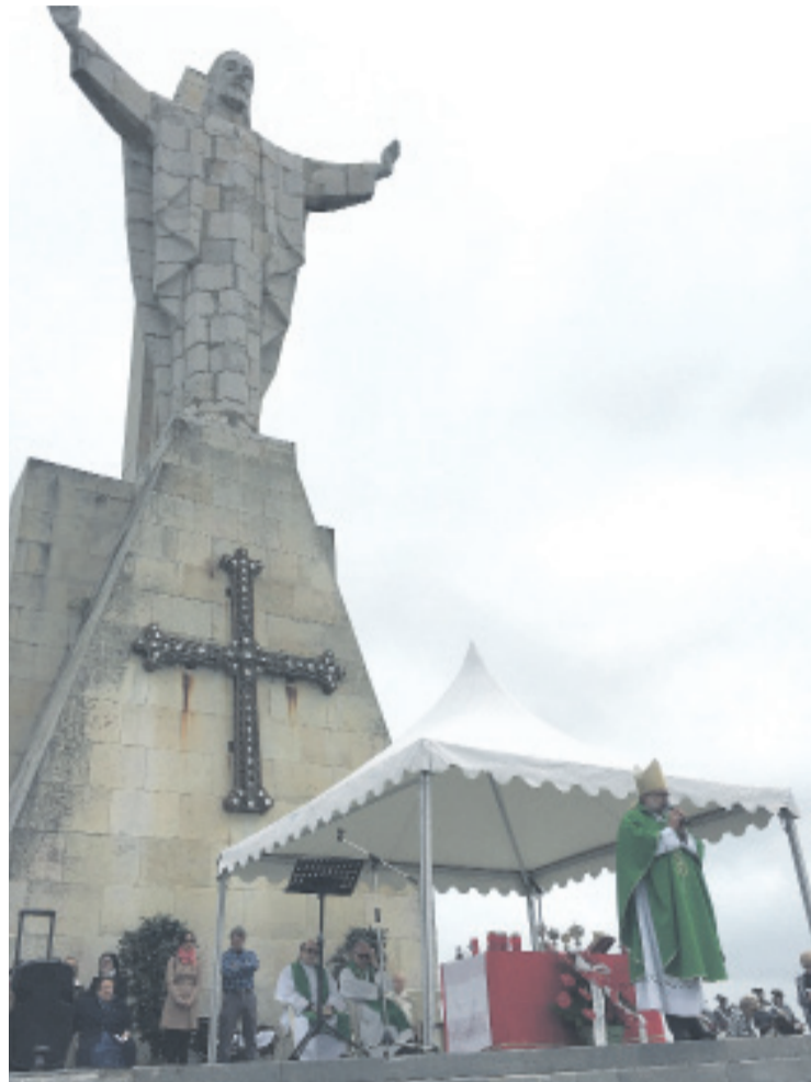
Eucaristía ante el monumento, en la Jira del año pasado.