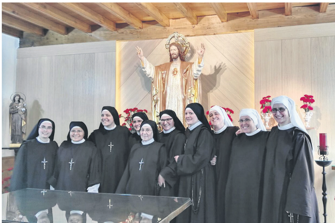
Un grupo de Carmelitas Samaritanas, en la capilla del Sagrado Corazón, de Valdediós.

nina, era poco conocida. Las Carmelitas Samaritanas del Corazón de Jesús respondían a un caris-