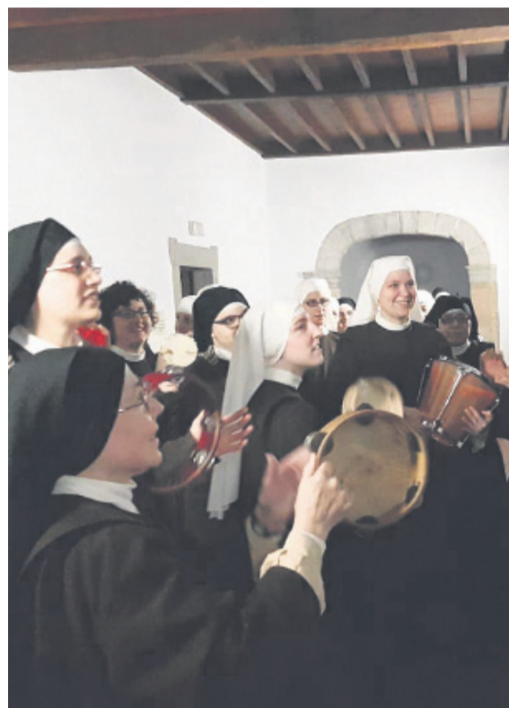
Arriba, presentación, hace un año, de las Carmelitas Samaritanas en Valdediós. Debajo, momentos cotidianos de la congregación.

etc.– lo más importante es nuestro carisma, para lo que hemos sido llamadas”.