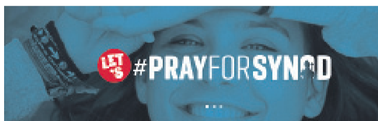
"Recemos por el Sínodo". Cartel preparatorio del Sínodo de los Obispos 2018.

Son dos encuestas, concretamente, una para jóvenes y otra para acompañantes, y se pueden responder en la misma página web de Pastoral Juvenil de la diócesis: www.pjasturias.org