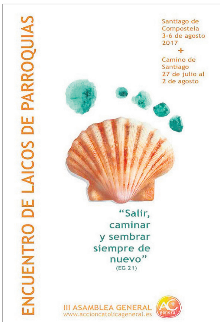
Cartel del encuentro de laicos.

En la diócesis, la preparación para este encuentro comenzó hace meses. Los responsables de la Acción Católica General en Asturias se entrevistaron con el Arzobispo, quien se comprometió con