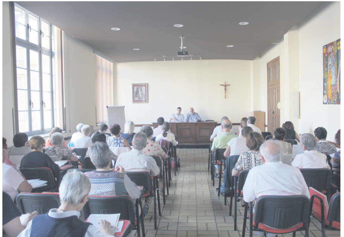
Uno de los cursos impartidos en la Semana diocesana de Formación del pasado año.

La Semana diocesana de Formación se coordina desde Vicaría General, ya que son 12 las Delegaciones que se ven involucradas en su desarrollo, mientras que la Delegación de Enseñanza lleva a cabo toda la “infraestructura”. “En marzo ya nos juntamos los Delegados