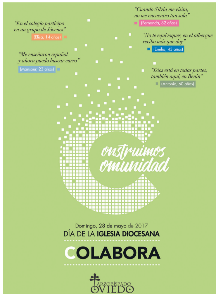
Cartel de la Jornada.

Esta campaña del Día de la Iglesia diocesana se engloba dentro de las actividades que realiza la Iglesia para financiarse, ya que su sustento depende exclusivamente de