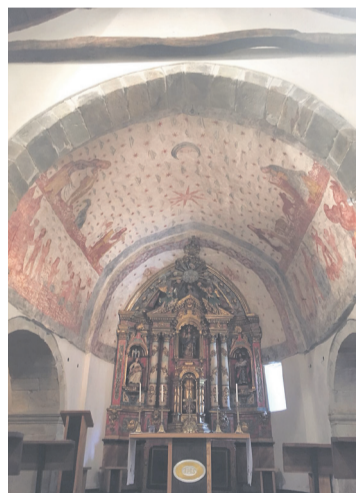
Interior del templo, ya restaurado.