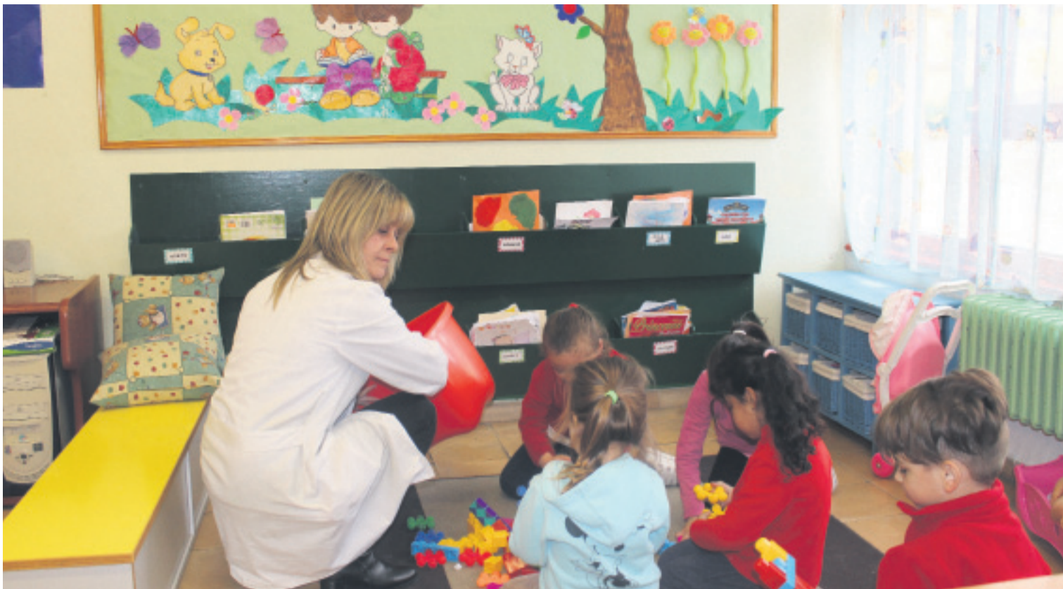
Una profesora del colegio, en el aula de Infantil.