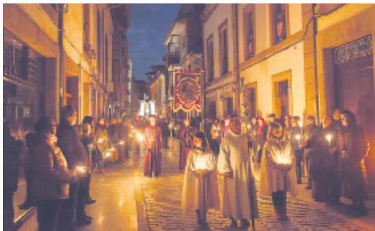
Semana Santa en Villaviciosa.

Este domingo celebrarán la bendición de los Ramos a las 12