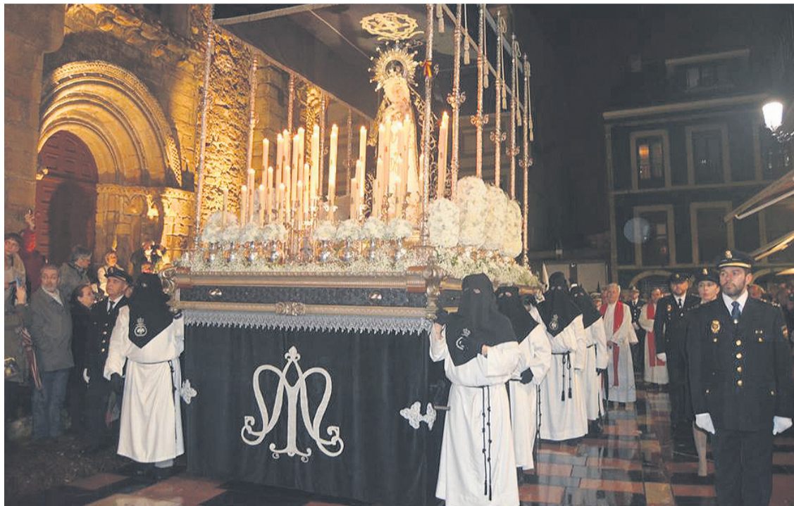
La Virgen de la Soledad, en procesión por las calles de Avilés.

Esta procesión se lleva a cabo con la colaboración de la Real Cofradía de Nuestra Señora de la Soledad y de la Santa Vera Cruz. Pero no es la única que la hermandad lleva a cabo en Semana Santa. También el sábado santo, por la noche, los penitentes o cofrades vuelven a protagonizar otra, conocida como de "la Re-