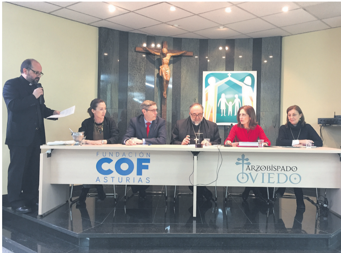
Presentación del COF diocesano, el pasado sábado.

“La vida nos importa, toda la vida y en cualquiera de sus tramos” –manifestó– “y por eso es un motivo de alegría, mirando a las familias y a las personas de todas las edades y circunstancias, que éstas puedan encontrar en este lugar y en las personas que lo dirigen y acompañan, motivos para esperar, para volver a empezar cuando han sido heridos, han