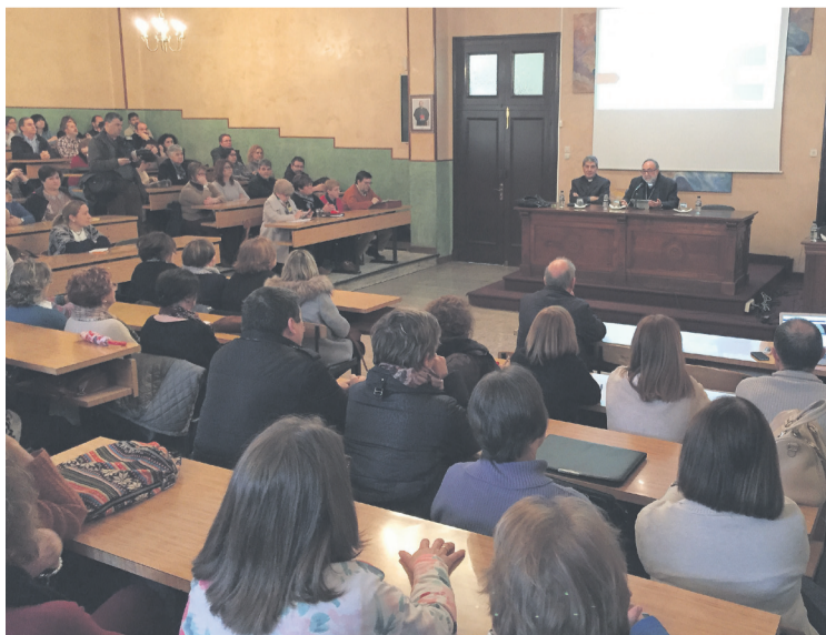
Un momento del encuentro en el Aula Magda del Seminario Metropolitano.

“Uno de los mantras más utilizados por quienes censuran y expulsan a la asignatura de Religión –señaló el Arzobispo de Oviedo– es la confusión entre la asignatura de Religión y la catequesis cristiana. Jamás las hemos confundido, aunque tengan evidentemente estrecha relación. Un profesor no es necesariamente un catequista,