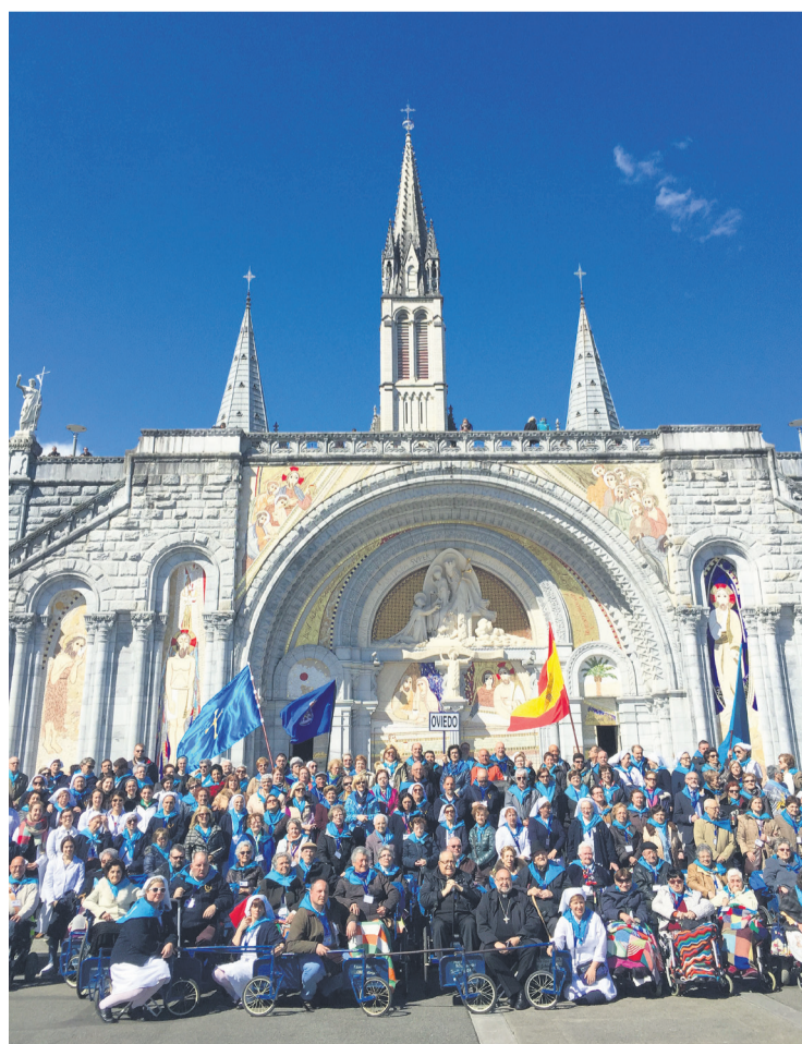
Fotografía de grupo de la Peregrinación a Lourdes del año pasado.