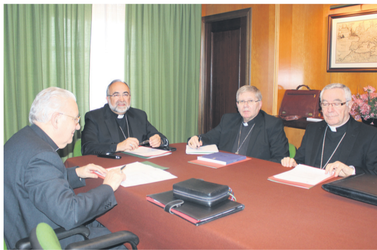
Los Obispos de la provincia eclesiástica, reunidos en la Casa Sacerdotal de Oviedo.