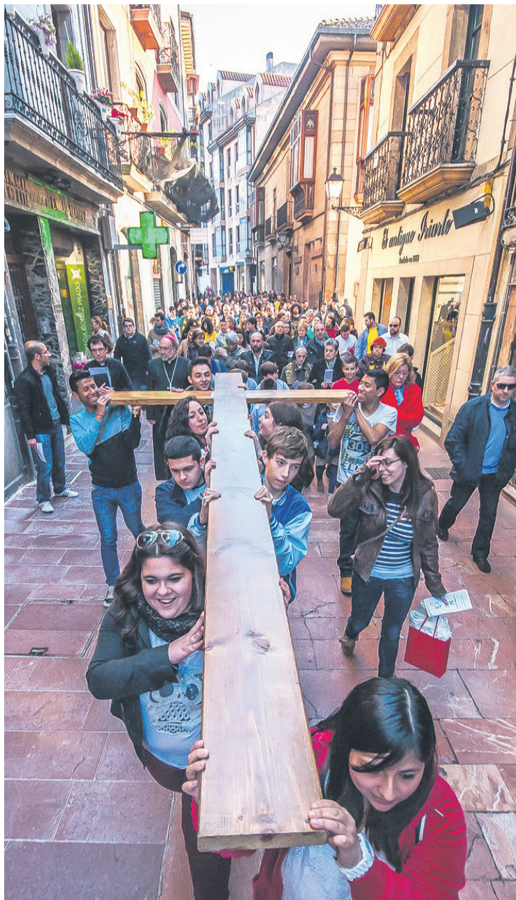
Procesión por las calles de Oviedo.