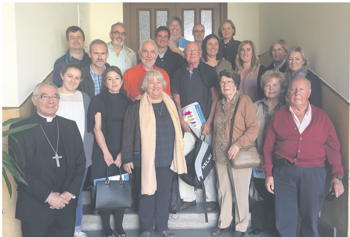
De arriba a abajo, una representación de las diócesis de Astorga, León y Santander, que acudieron al encuentro en el Seminario de Oviedo, acompañados por sus respectivos obispos.

tradicional, moderna o postmoderna, sino que estamos trabajando para que la familia responda al ideal del Evangelio. Eso es lo que a nosotros nos interesa, y es, desde luego, algo más que progresista, porque está por encima del tiempo”. Señaló también en su intervención que no es fácil mantenerse al margen de la cultura dominante, en la que “se ataca a los fundamentos de la familia, dentro de una sociedad consumista, relativista, sin verdades, donde todo es opinable depende de quién lo diga y cuándo lo diga. A todos nos está afectando esta manera de entender las familias y la convivencia social”, afirmó. Por ello, recordó que “hay gente que está empeñada en que la Iglesia tiene que asumir estos nuevos modelos de familia que hay en circulación como signo de adaptación de los tiempos, lo cual es un error. Otra cosa es que tengamos que difundir la doctrina de la Iglesia y proponerla al hombre de hoy con el lenguaje de hoy, y que tengamos que tener en cuenta las circuns-