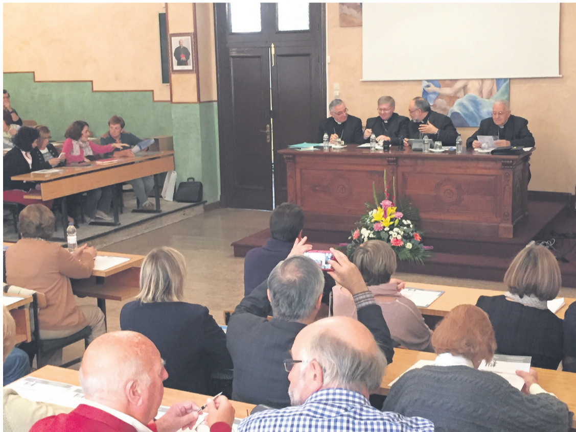
Los obispos de la Provincia Eclesiástica presidieron el encuentro de laicos, el pasado sábado.

Asimismo acudieron 15 representantes de la diócesis de León, 20 de Santander y 30 de Astorga, todos ellos acompañados por sus respectivos obispos, para participar en el encuentro.