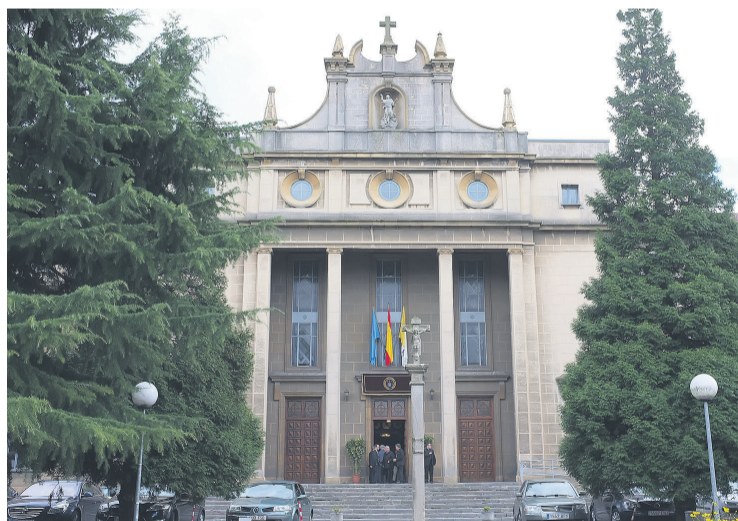
Seminario Metropolitano de Oviedo.

En el primer cuatrimestre, que dará comienzo el 28 de septiembre, se ofrecerán los cursos “Iconografía de la Catedral de Oviedo”; “Curso fundamental de la fe de Karl Rahner”; “Comparativa del cristianismo y la religiosidad africana”; “Arqueología cristiana”; “Misionología”; “El mundo de las creencias sobrenaturales en la Edad Moderna” y “Solfeo y musical I”. El segundo cuatrimestre,