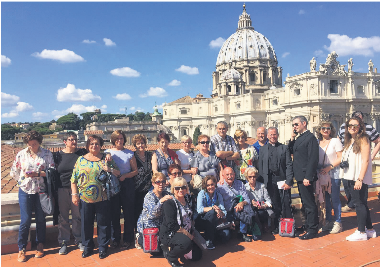
Los catequistas asturianos, delante de la Basílica de San Pedro, en El Vaticano.

Semanario de Información del Arzobispado de Oviedo • D.L.: O-388-65 • Directora: Ana Isabel Llamas Palacios • 29 de septiembre de 2016 • Núm. 1284