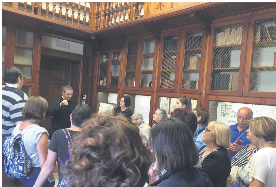
Visita de los catequistas asturianos a la Congregación para la Doctrina de la Fe.