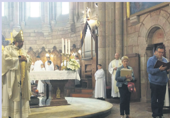
Un momento de la celebración, en Covadonga.

Habitualmente esta celebración tiene lugar en la Catedral de Oviedo, pero este año, con motivo del Jubileo de la Misericordia, se ha desarrollado en Covadonga, uno de