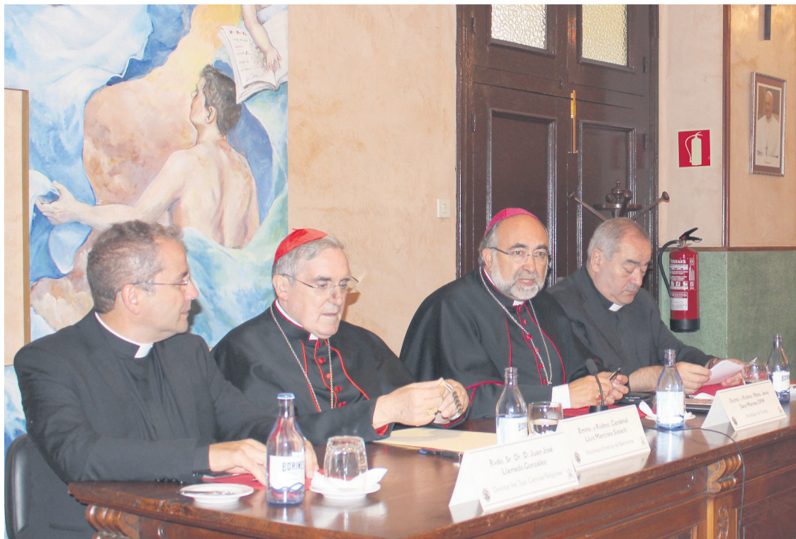
Un momento del acto de inauguración del curso.

Al finalizar la misa, los participantes se dirigieron al Aula Magna del Seminario, donde tuvo lugar, en un primer momento, la lectura de la Memoria del pasado año académico. Posteriormente, el Delegado episcopal de Cultura y Nueva Evangelización, Fernando Llenín, dio paso a la conferencia del invitado, Mons. Martínez Sistach, quien habló sobre “La laicidad positiva del Estado al servicio de la sociedad multirreligiosa”. Un tema, según el cardenal, “muy actual, especialmente en Europa occidental pero presente también, de una forma u otra, en el resto del