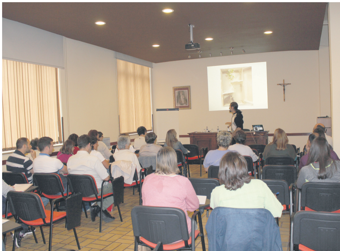
Un momento de la Semana diocesana de Formación del pasado curso.