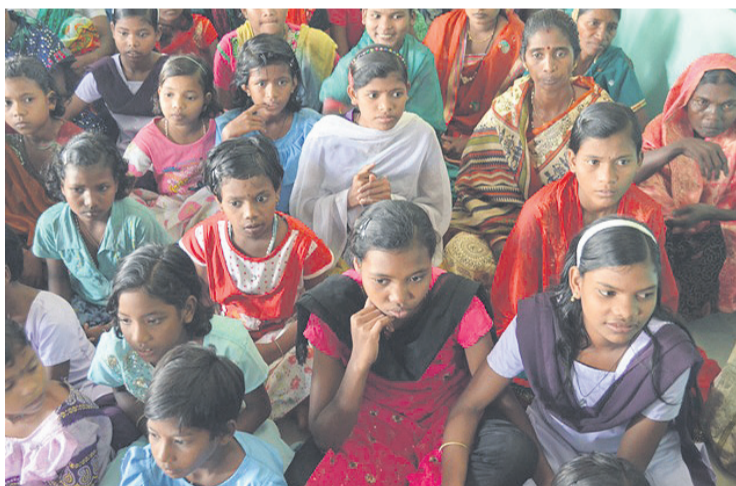
Niñas internas en la aldea de Jubaguda.

pletamente aislada del mundo exterior. Sus habitantes tienen un analfabetismo cercano al 100%. Las Hermanas de la Caridad de la más preciosa sangre fundaron en 1995 un internado con una capacidad para 80 niñas y que actualmente acoge a 120. Con lo recaudado por estos arciprestazgos se ha podido financiar una planta superior de igual superficie a la inferior, que servirá para descongestionar las instalaciones, a la vez que se crearán 30 plazas nuevas.