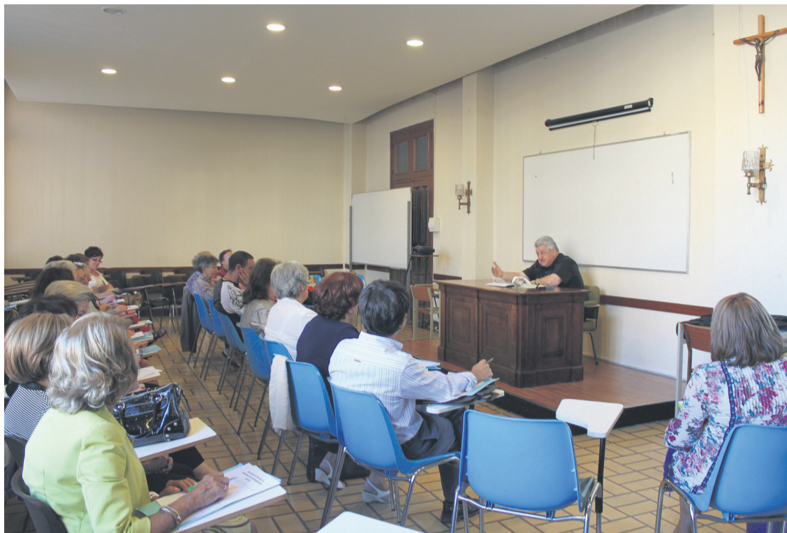
Una clase de la Semana diocesana de Formación.

Esta página propia de la Semana lleva funcionando tres años. El primero de su existencia, las matriculaciones on line convivieron con las presenciales, pero fueron tan escasas estas últimas, que se optó por el sistema informático, que resulta fácil e intuitivo. Además, se han distribuido como siempre a través de parroquias e instituciones folletos donde vienen especificados los cursos, con un código QR para facilitar inclu-