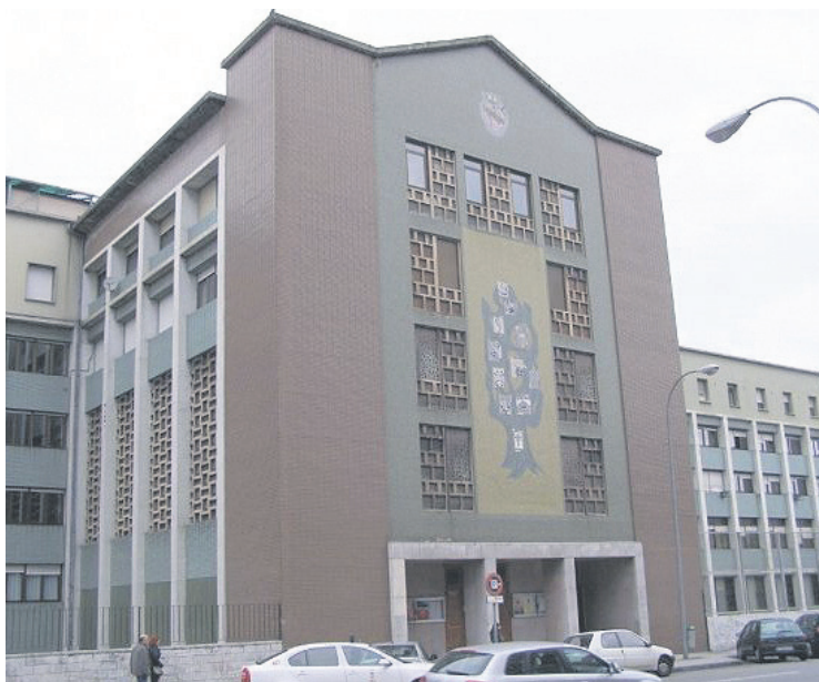
Parroquia del Corazon de María, de Gijón.

Durante esta semana, además, está teniendo lugar en la parroquia un Triduo de Preparación para el aniversario, en torno a la misa diaria de las 19,30 h., que dió comienzo ayer, y que se prolongará durante hoy y mañana. Unos actos conmemorativos que vienen sucediéndose desde la semana pasada, con conferencias sobre la historia de la parroquia.