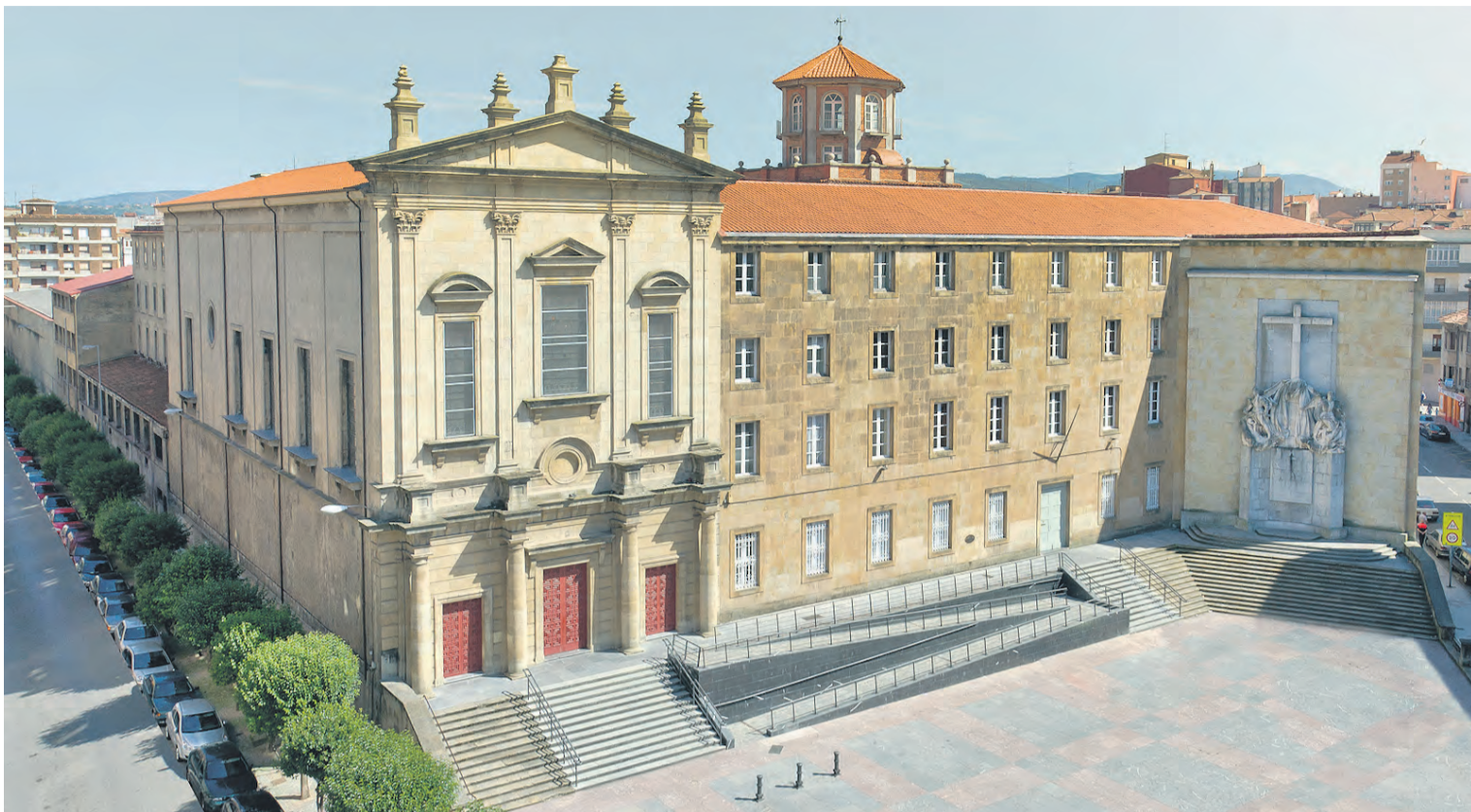
Estado actual del colegio Inmaculada Concepción, dirigido por los padres jesuitas, en Gijón.