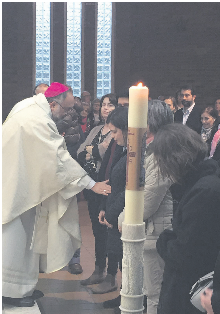
Momento de bendición a las embarazadas, el pasado lunes, en los Santos Apóstoles.