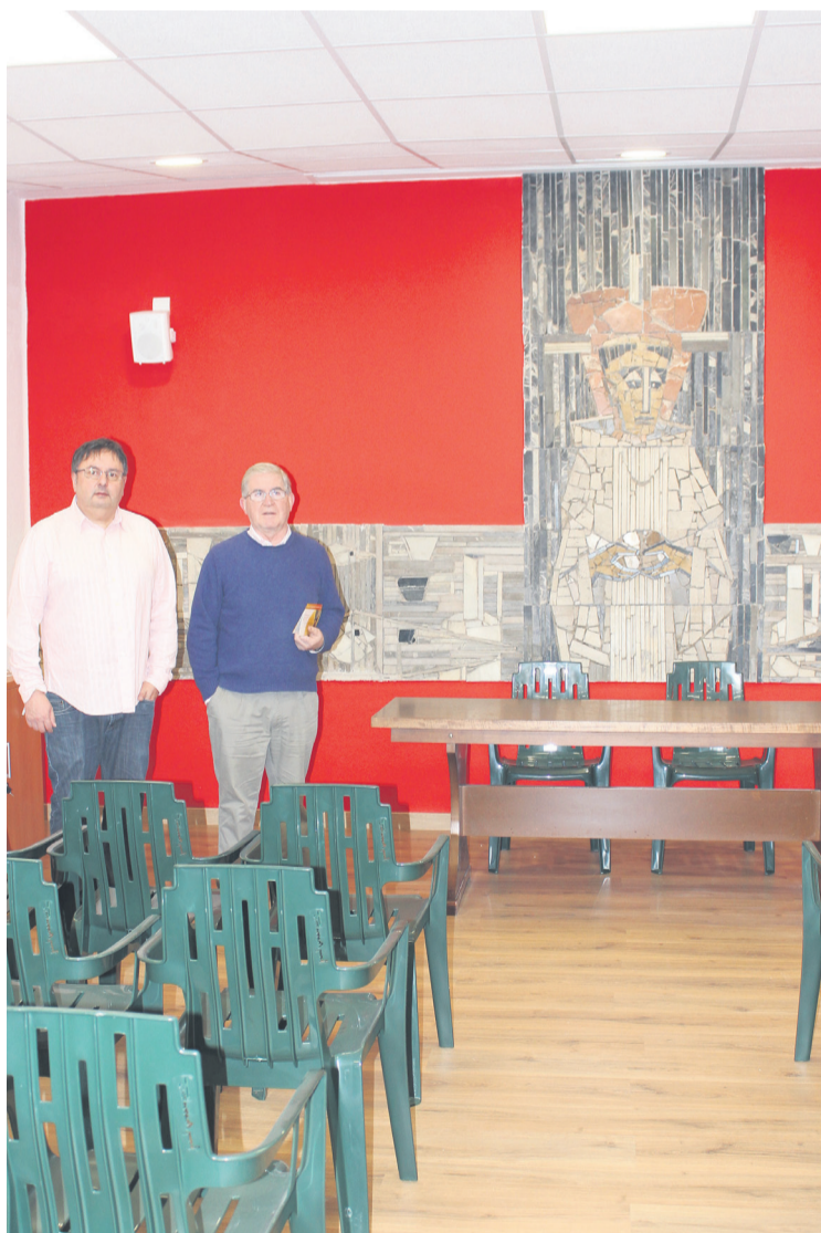
Sobre estas líneas, la cocina que acogerá la iniciativa “Desayunos solidarios”. A la izquierda, el salón de actos, con un mosaico de Santo Domingo, situado en lo que fue antiguo refectorio de los frailes.

“Es lo primero, saber que esto tiene que ver con el Evangelio, con el Reino de Dios, no con otra cosa”, y en segundo lugar, “estar muy abierto y enamorado de la gente”. En este sentido, desde la Orden de Predicadores encuentran una feliz coincidencia vivir su octavo centenario con el Año de la Misericordia, porque, según afirman, si hay una palabra que define a santo Domingo, ésta es la “compasión”: “nos ha venido muy bien que el Papa Francisco haya dicho que si no se tiene entraña, no hay nada que hacer”, porque “el espíritu de la Orden nos llama a encontrarnos con la gente y amarla, desarrollando cada uno nuestra labor particular, de trabajo, de investigación, en las misiones o en la docencia, por ejemplo”, afirma.