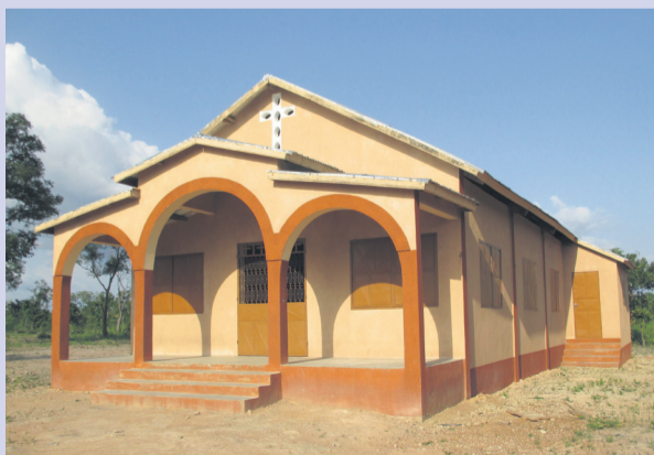
Modelo de templo de la misión diocesana de Benín, en el que se basarán para la construcción de la iglesia de Sinau.

“En esa zona necesitaban ya un espacio digno para celebrar la fe, puesto que la capilla de adobe que tenían hasta