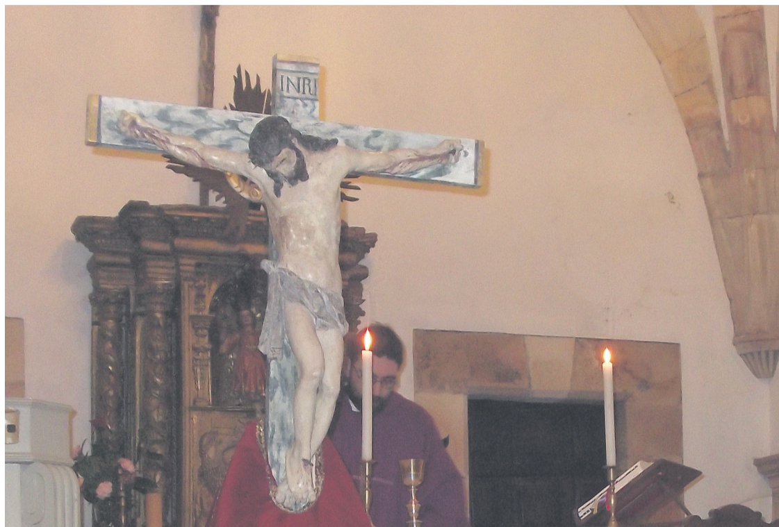
El Cristo de Cecos, el día de su nueva entronización en la parroquia.

En la Escuela de Avilés hicieron una valoración del estado de conservación de la pieza, y determinaron que podrían intervenir en