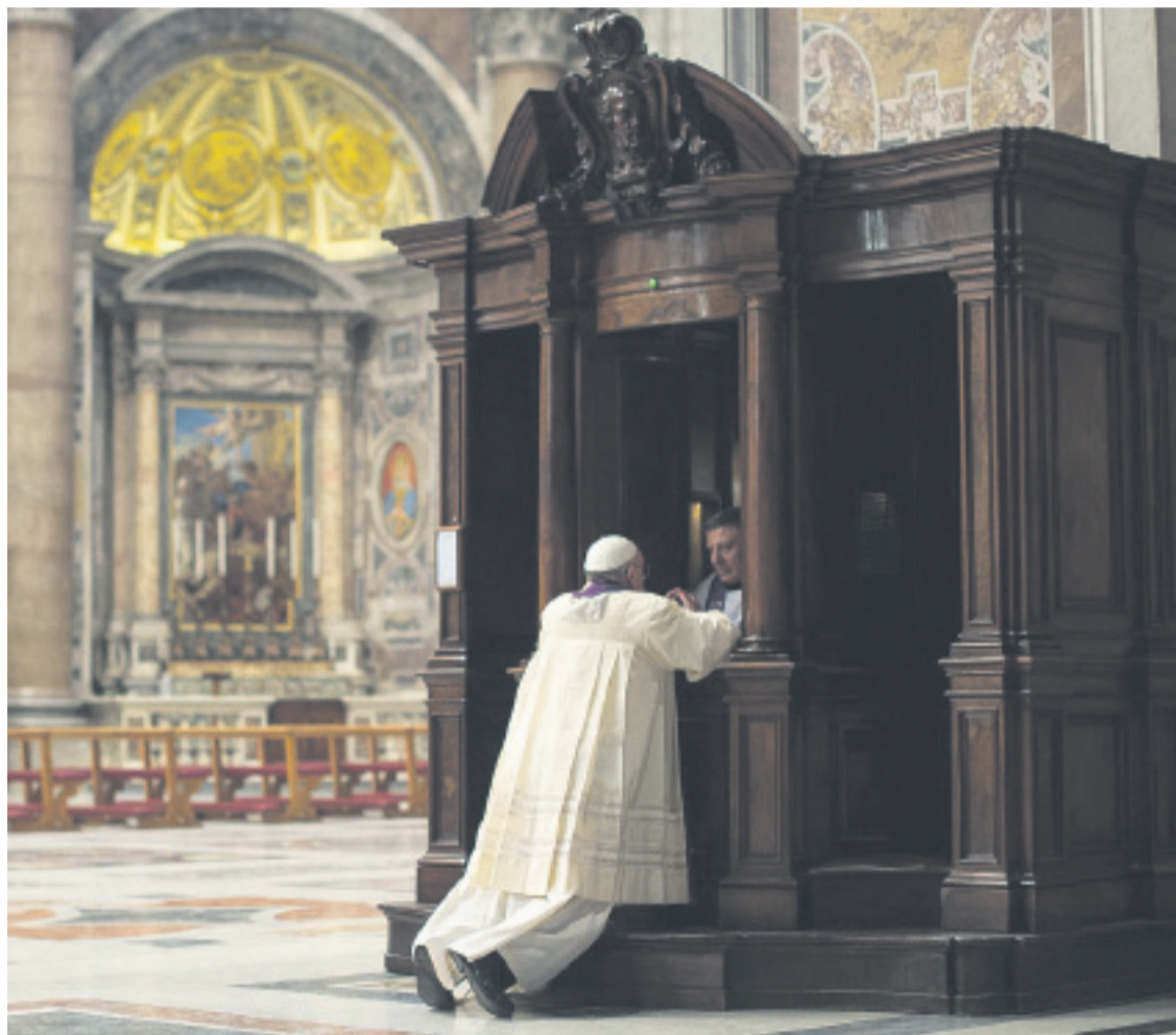
El Papa Francisco, confesándose en San Pedro.