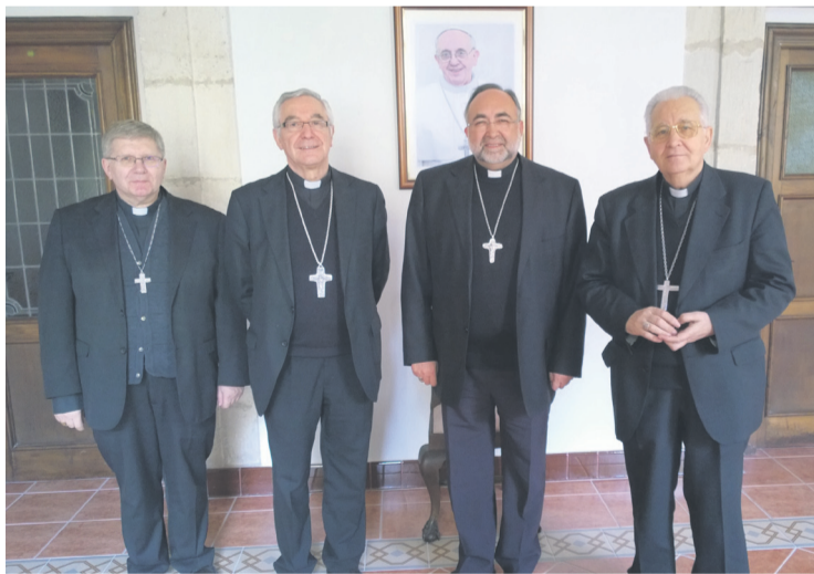
Los Obispos de Astorga, Santander, Oviedo y León, reunidos en Santander.

Los Seminarios y las vocaciones a la vida sacerdotal, así como el acompañamiento de los jóvenes con vocación fue también otro de los temas que se trataron en la reunión, haciendo hincapié en