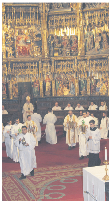
Un momento de la celebración.

Se trata de una Eucaristía que se celebra una vez al año, poco antes del mismo Jueves Santo, por la que los presbíteros renuevan sus promesas sacerdotales, y se bendi-