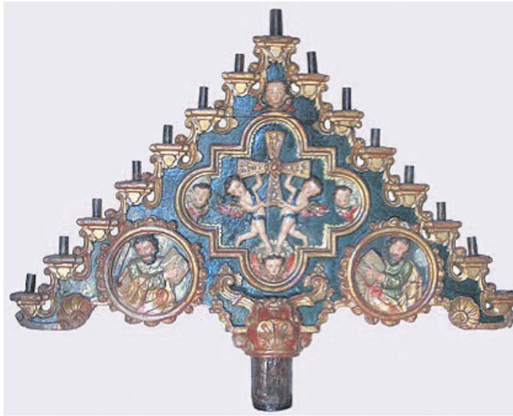
Tenebrario de la Catedral, hoy conservado en el Museo diocesano. A la derecha, grafiti de Tenebrario dibujado en la torre de la Catedral de Oviedo.

El tenebrario –se usaba ya en el siglo VII; lo menciona el ritual de Jean Mabillon– era un candelabro con quince cirios que se van apagando uno tras otro tras la oración de cada salmo. Dramatizaba a los 11 apóstoles que, aunque permanecieron tras la traición de Judas, también apagan su presencia y compañía. Tres velas simbo-