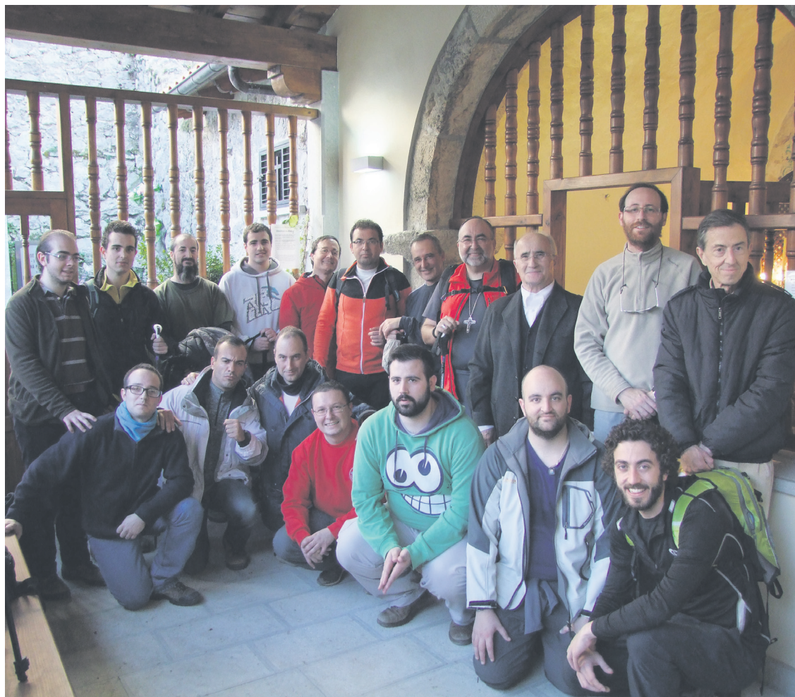
PÁGINA 2 Los seminaristas asturianos, de excursión con Mons. Jesús Sanz.

Para finalizar, y como todos los años, se ofrecerá, a última hora de la tarde, un vino español junto con las familias que han acudido a acompañarles.