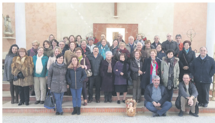
El grupo de agentes de pastoral reunidos en Posada de Llanera.

El objetivo del encuentro pretendía responder al Plan Pastoral Diocesano, que en su primer objetivo específico habla de la "Comunión Eclesial". Junto con los agentes de pastoral, estuvieron