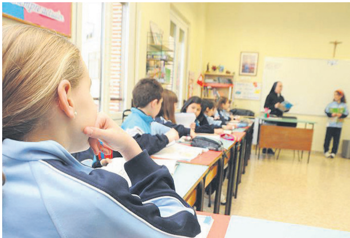
El 64% de los alumnos asturianos escogen la asignatura de Religión.

Por un lado, el número de alumnos de Infantil en los Centros de Titularidad Pública que han elegido este año la asignatura ha descendido hasta el 58%, siguiendo una lenta tendencia a la baja que lleva años produciéndose. En el curso 2013-2014 la cifra era del 65% y en el 2014-2015, fue del 61%. Son, en total, siete puntos menos en tan sólo tres años.