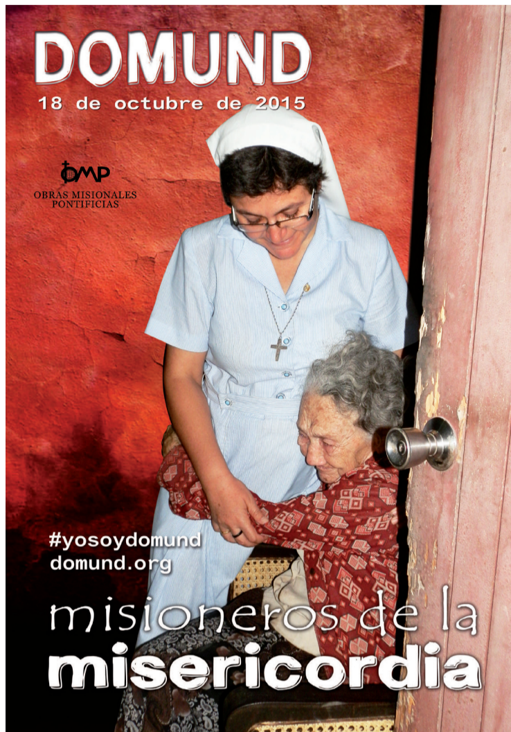
Cartel del Domund 2015.