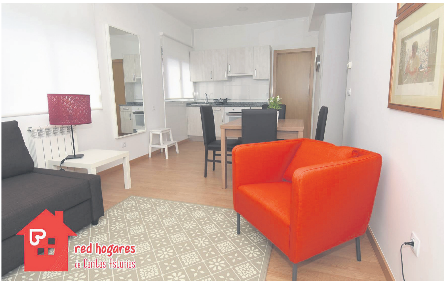
Salón comedor de uno de los apartamentos del Natahoyo para familias sin hogar, bendecidos el pasado lunes.