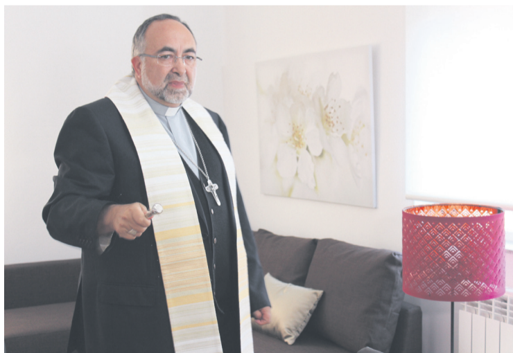
Mons. Jesús Sanz bendiciendo las instalaciones, el pasado lunes.

El pasado lunes, el Arzobispo de Oviedo, Mons. Jesús Sanz, bendijo las instalaciones, en un