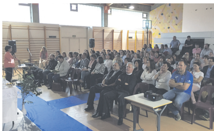
Un momento del encuentro, en el colegio Santo Tomás de Avilés.

El proyecto pretende, por un lado, seguir las directrices de la Sagrada Congregación para la Educación y unificar el estilo de