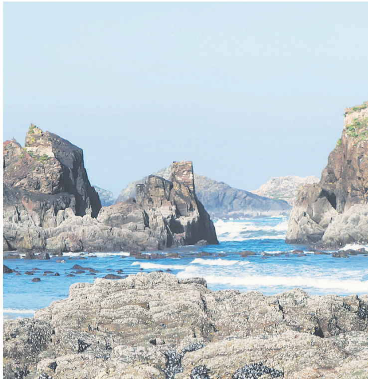
Playa de Porcia (Tapia de Casariego).

Entiendo que la atención primera que se debe dar en las parroquias de veraneantes es atender sus demandas: poner el sello parroquial en su compostela (la credencial oficial del peregrino a Santiago de Compostela); darles información: para ello se expondrá en lugares visibles del templo y otros en la villa los horarios de Misas en varios idiomas, teléfonos del párroco... Algunos veraneantes en ocasiones desean hablar con el párroco para tratar algún tema de conciencia, para confesar, para pedir una información... La actitud por parte del párroco ha de ser siempre amable y servicial. Esto