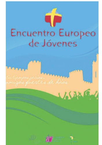
Cartel oficial del Encuentro.

Los participantes asturianos proceden de parroquias de Gijón, Oviedo, Avilés y Cangas del Narcea, así como del Movimiento Scout Católico.