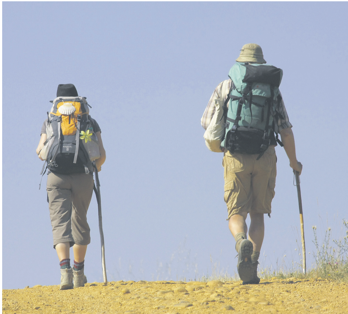
Peregrinos del Camino de Santiago.