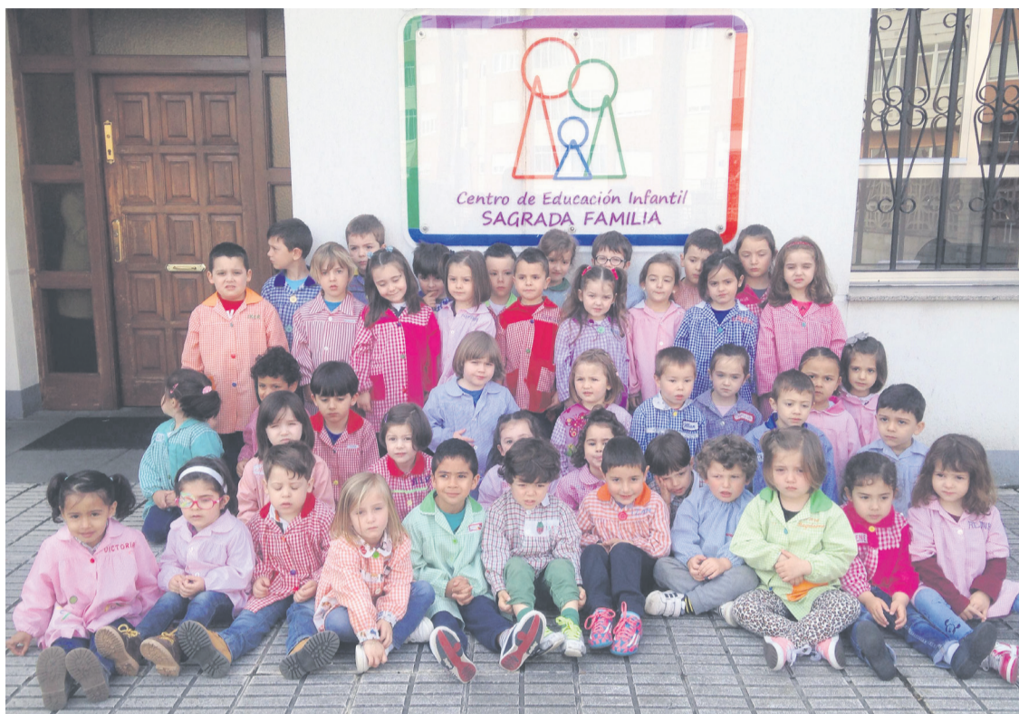
Un grupo de alumnos del Centro infantil Sagrada Familia, en Las Vegas; a la izquierda, niños del Centro San Eutiquio, en Gijón.

La confianza de los padres en la escuela es algo “fundamental”, según la directora, porque “aún hoy muchos padres se sienten culpa-