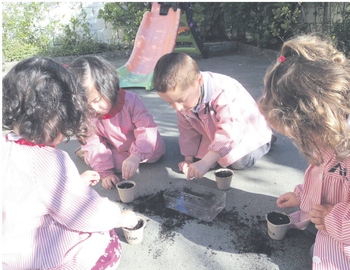
Niños en el Centro Infantil El Bibio, en Gijón.