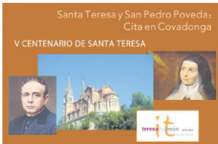
Cartel del encuentro de este sábado, 2 de mayo.

El Encuentro tendrá lugar en la Casa Capitul, dará comienzo a