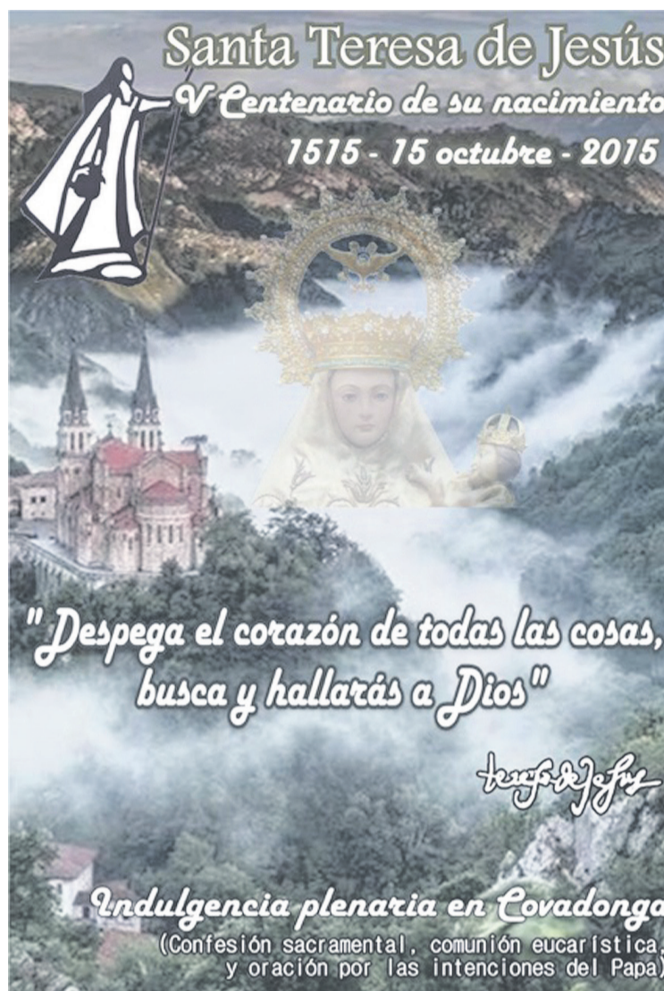
Cartel conmemorativo del V Centenario de Santa Teresa, que se mostrará en Covadonga.