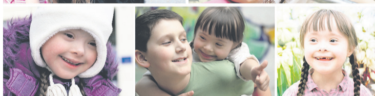
Cartel de la Jornada por la Vida 2015.

persona débil o enferma”. Desde la Iglesia, se hace un llamamiento a implicarnos en la defensa de la