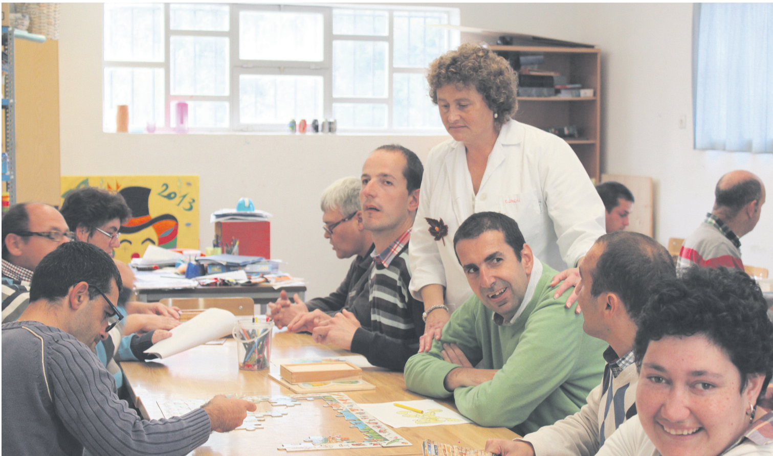
Discapacitados en un taller en el Centro Don Orione de Posada de Llanes.