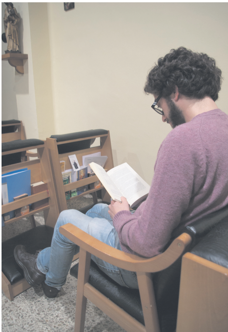
Un momento de formación, en el Seminario Metropolitano de Oviedo; abajo, un seminarista en la capilla.

abandona a su Iglesia, y lógicamente para nosotros es motivo de alegría y agradecimiento. Es algo que percibimos en las parroquias, entre los ancianos y enfermos –cuya oración es fundamental–, pero también entre los jóvenes, que les miran con una mezcla de curiosidad y admiración, o asombro”.