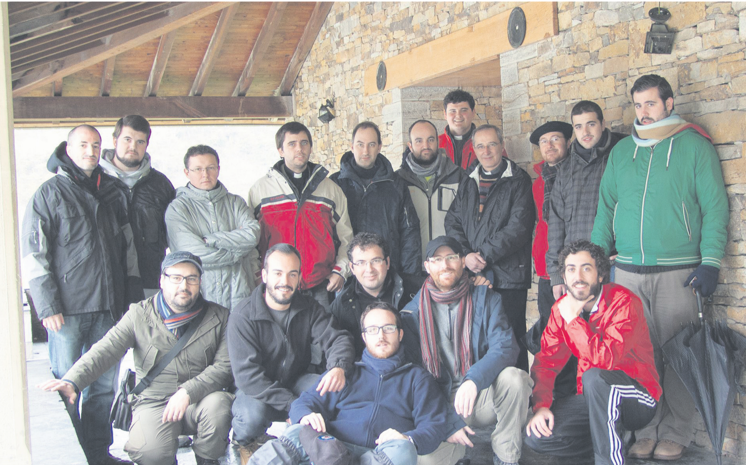
El grupo de seminaristas del Seminario Metropolitano de Oviedo, en una excursión a Posada de Rengos.

Semanario de Información del Arzobispado de Oviedo • D.L.: O-388-65 • Directora: Ana Isabel Llamas Palacios • 19 de marzo de 2015 • Núm. 1213