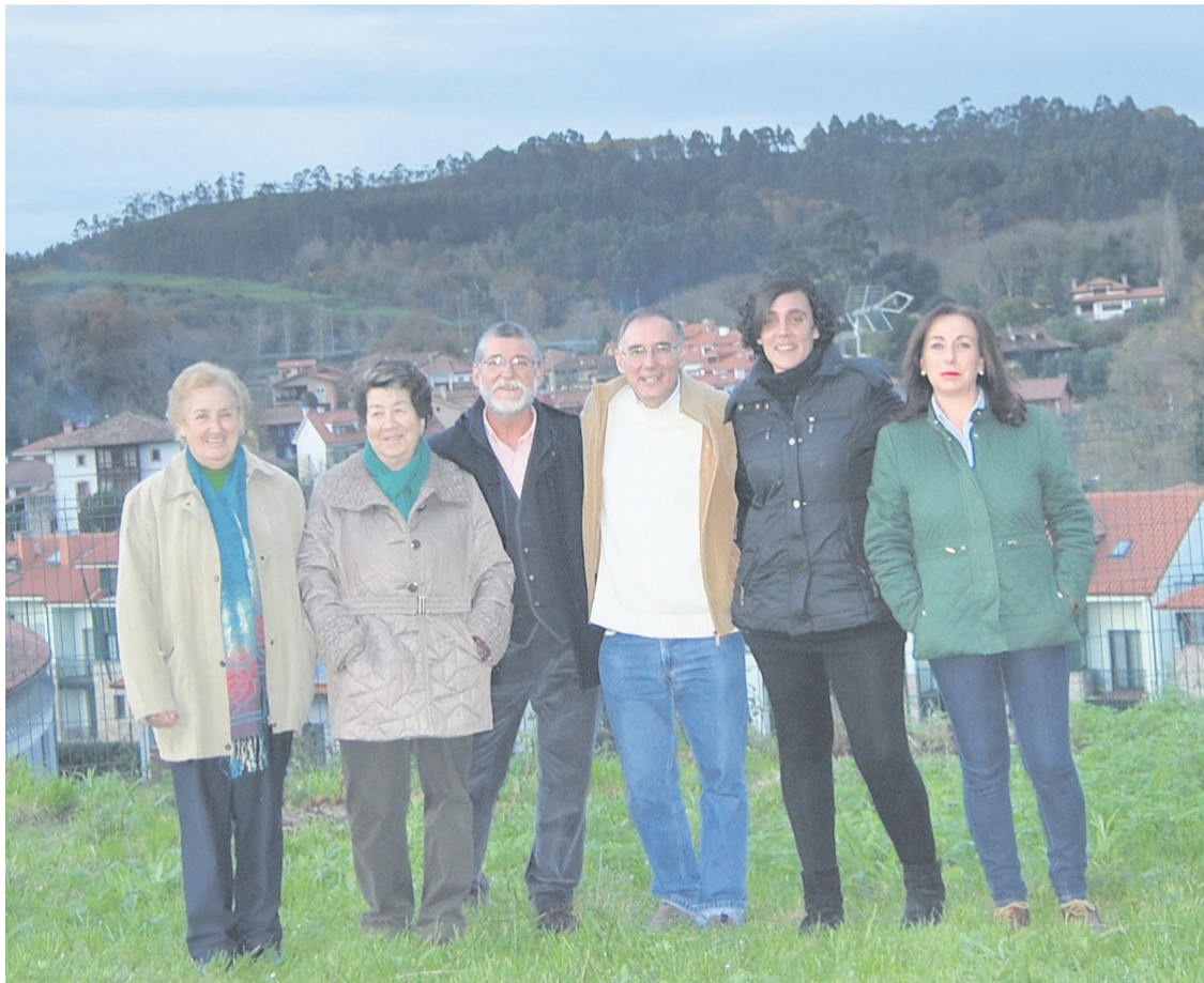
PÁGINA 2 El recién formado grupo de Cáritas de la parroquia de Nuestra Señora de La Asunción, de Posada de Llanes

Se trata de un voluntariado muy particular, no está especializado en un problema concreto de los muchos de los que se encarga Cáritas, sino que son los responsables de acoger a los recién llegados, y hacerlo con el estilo particular de la institución: con la auténtica caridad, que no es sólo “dar”, sino ser signo de esperanza, acoger y acompañar. Por eso la parroquia es el “primer núcleo de la caridad”.