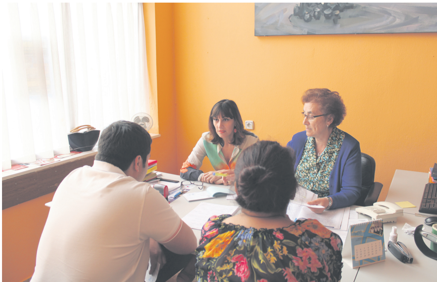
Dos voluntarias, trabajando en el Acompañamiento y la Acogida de la Cáritas parroquial de la Basílica de San Juan de Oviedo.