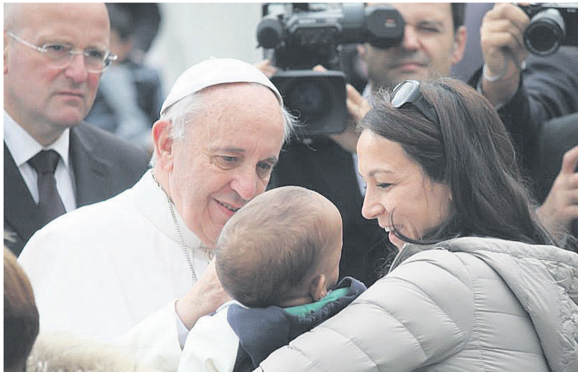
El Papa Francisco bendice a un niño; a la izquierda, cartel del Sínodo sobre la Familia para este año.