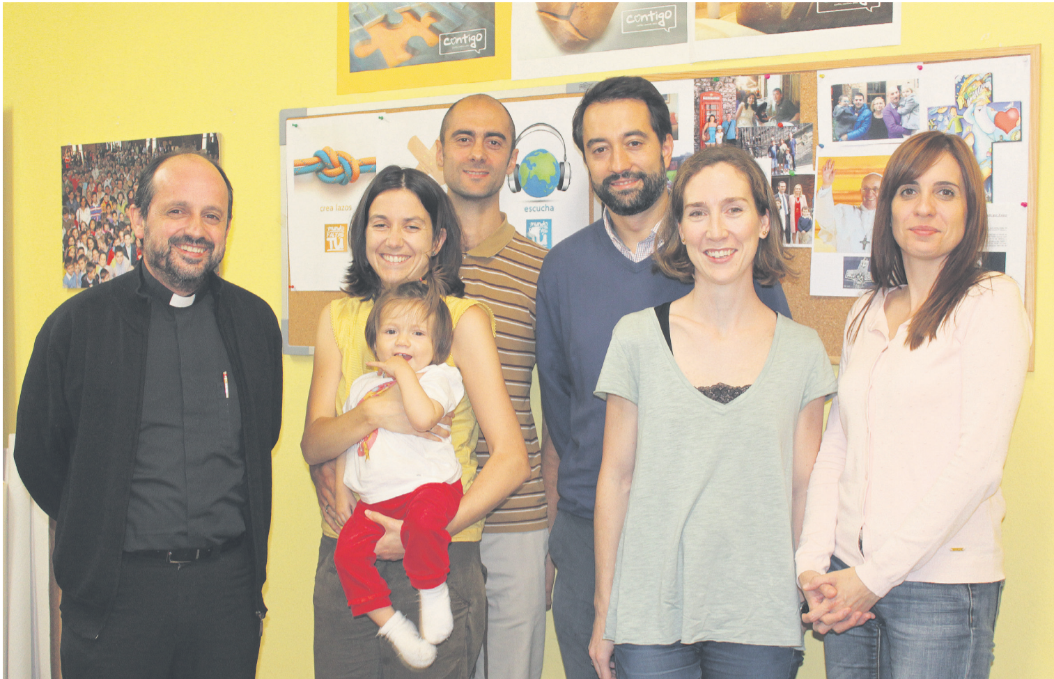
El equipo de la Delegación de Pastoral Familiar de la archidiócesis de Oviedo.

Semanario de Información del Arzobispado de Oviedo • D.L.: O-388-65 • Directora: Ana Isabel Llamas Palacios • 2 de octubre de 2014 • Núm. 1191