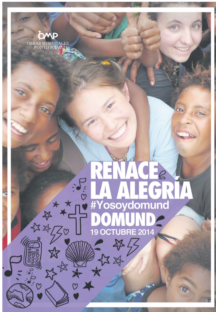
Cartel de la Campaña del Domund 2014.

Todos los donativos del DOMUND que se recogen en el mundo pasan a formar parte del Fondo Universal de Solidaridad