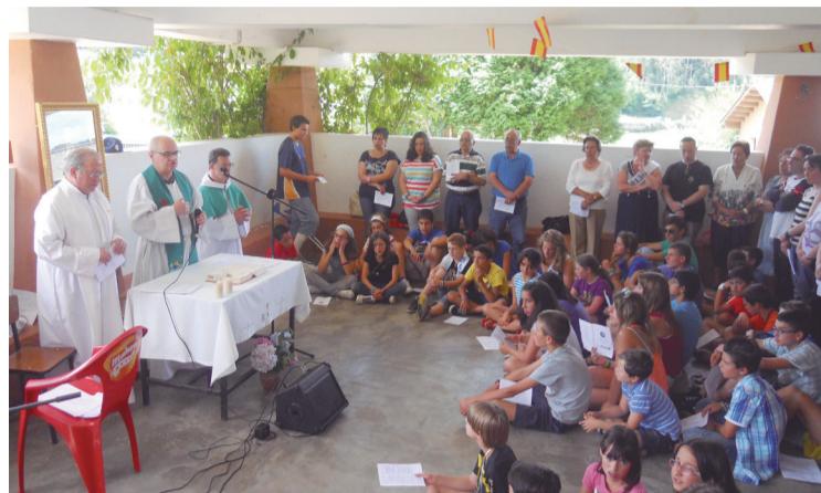
Una misa de domingo, en el campamento de la parroquia de San José de Pumarín.

El propio Francisco comenzó con 19 años de monitor: “me había confirmado en la parroquia, y decidí apuntarme. Y una vez que comienzas como monitor, es imposible dejarlo, pues es algo que te engancha. Es muy motivador ver disfrutar a los críos durante 15 días con la naturaleza y entre ellos, sin tele, sin consolas”, reconoce. Al tiempo que asegura que “las relaciones que se establecen entre ellos son muy largas y les hacen un gran bien. Comienzan el campamento con 7 años y se quedan hasta los 17”.