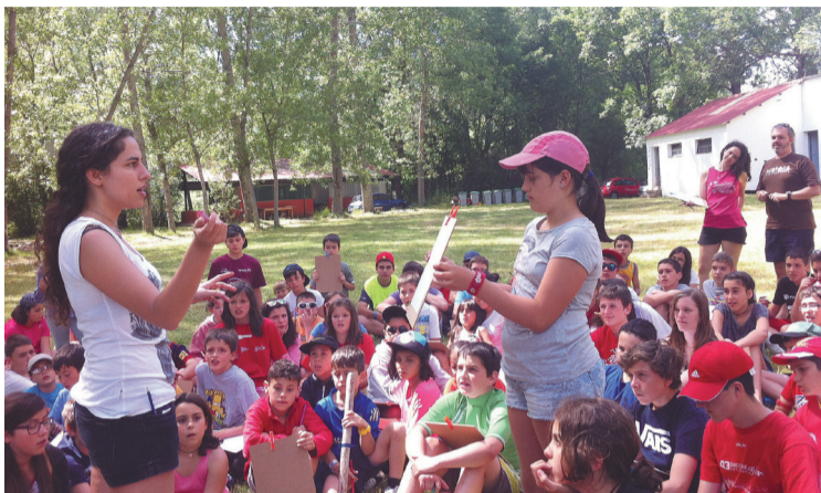
El campamento de la Acción Católica de Asturias, en Sena de Luna (León).

Parroquias, Movimiento Scout o la Acción Católica se movilizan para vivir unas vacaciones diferentes