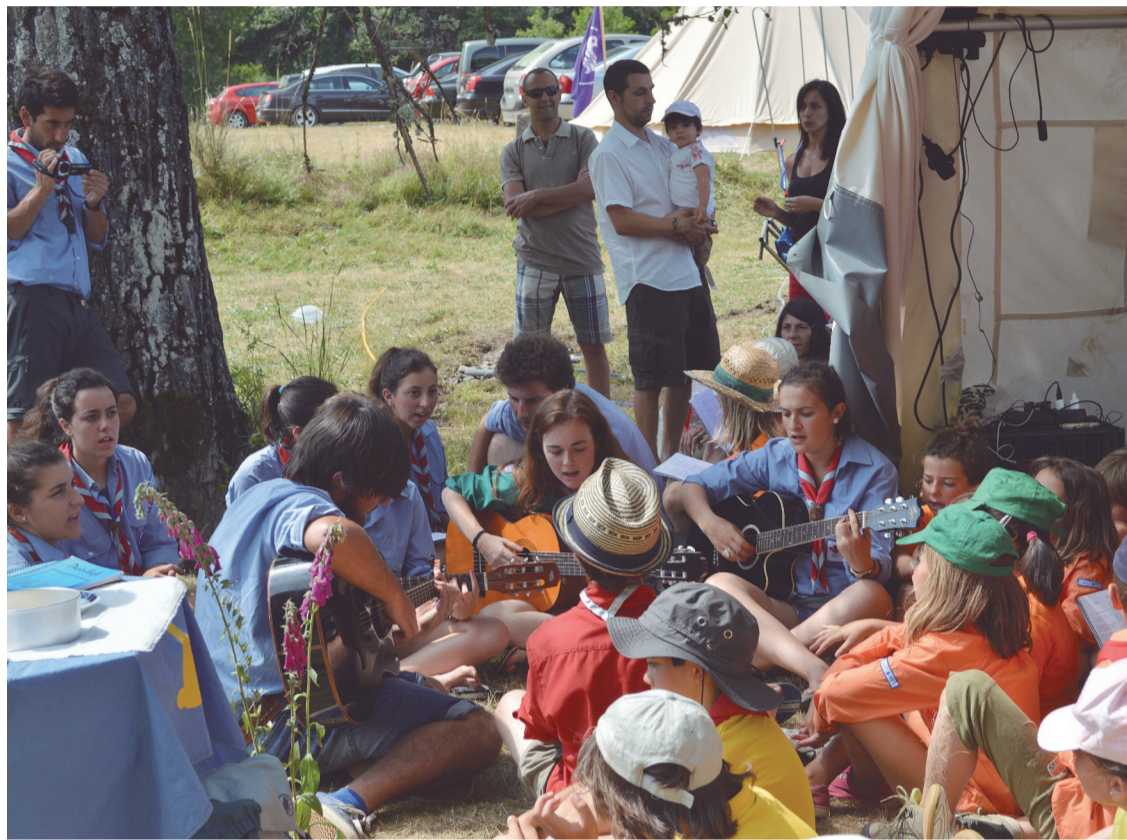
Un grupo de jóvenes asturianos del Movimiento Scout Católico.

Monitores titulados, sacerdotes y hasta padres que cogen vacaciones para hacerse cargo de los campamentos son los responsables de que, durante diez o quince días los chicos vivan una experiencia diferente y en muchos casos inolvidable. En Asturias, el destino elegido es, por lo general, León, sus ríos y sus montañas, donde “el tiempo está asegurado”. PÁGINA 2