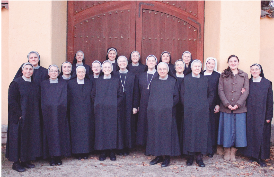
La comunidad chilena con la representación de religiosas del monasterio de San Pelayo de Oviedo, en su última visita.

La Comunidad cuenta en la actualidad con dieciséis monjas, y dos jóvenes en el noviciado (una juniora y una postulante). De en-