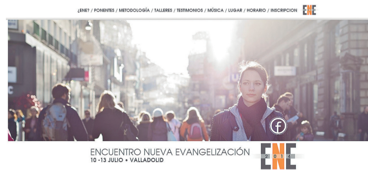
Cartel del Encuentro en Valladolid.

“La frase que resumiría este encuentro –según nuestro Delegado diocesano– es formar líderes para hacer discípulos . Hasta ahora nosotros lo que hacíamos era sa-