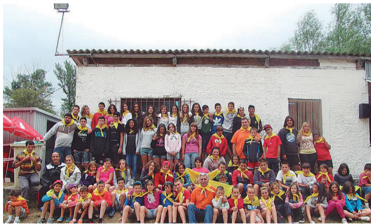
El grupo del campamento en Rodiezmo, el pasado verano.