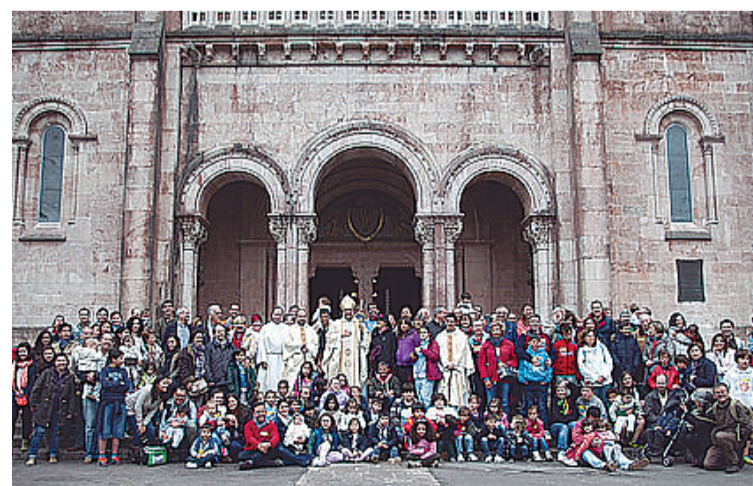
Foto de grupo de la Marcha de Jóvenes a Covadonga, este año.

jurado valorará, entre otros, la facilidad de identificación de la propuesta con la Pastoral Juvenil y el diseño innovador, creativo y sugere-