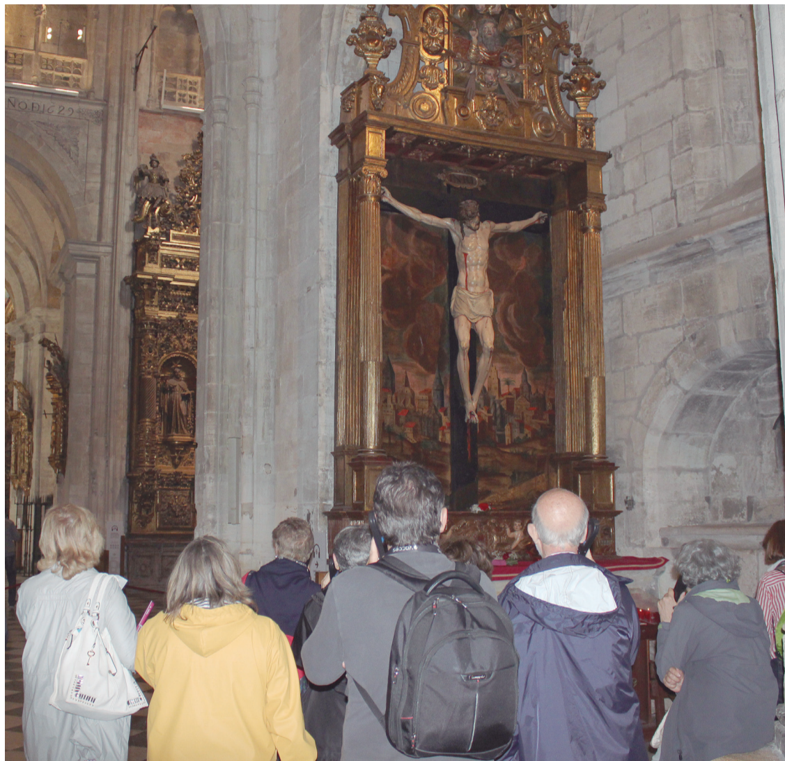
Visitantes en la Catedral de Oviedo, escuchando las explicaciones de la audioguía.

Poco a poco las aguas vuelven a su cauce y a las primeras semanas de adaptación al pago de la entrada, la rutina se va imponiendo y los objetivos que se habían propuesto para poder hacer frente a los gastos del templo de El Salvador van cumpliéndose. Son ya más de 400 las personas que se han hecho con un carnet para poder visitar la Catedral tantas veces como lo deseen durante un año, y también, como novedad, este año se ha incrementado notablemente la cifra de peregrinos a Santiago que pasan por Oviedo, y recalán en la Catedral para sellar su credencial: “de los 15 que venían a diario, a los 50 que llegan ahora todos los días”, señala el propio Deán, Benito Gallego. PÁGINA 2