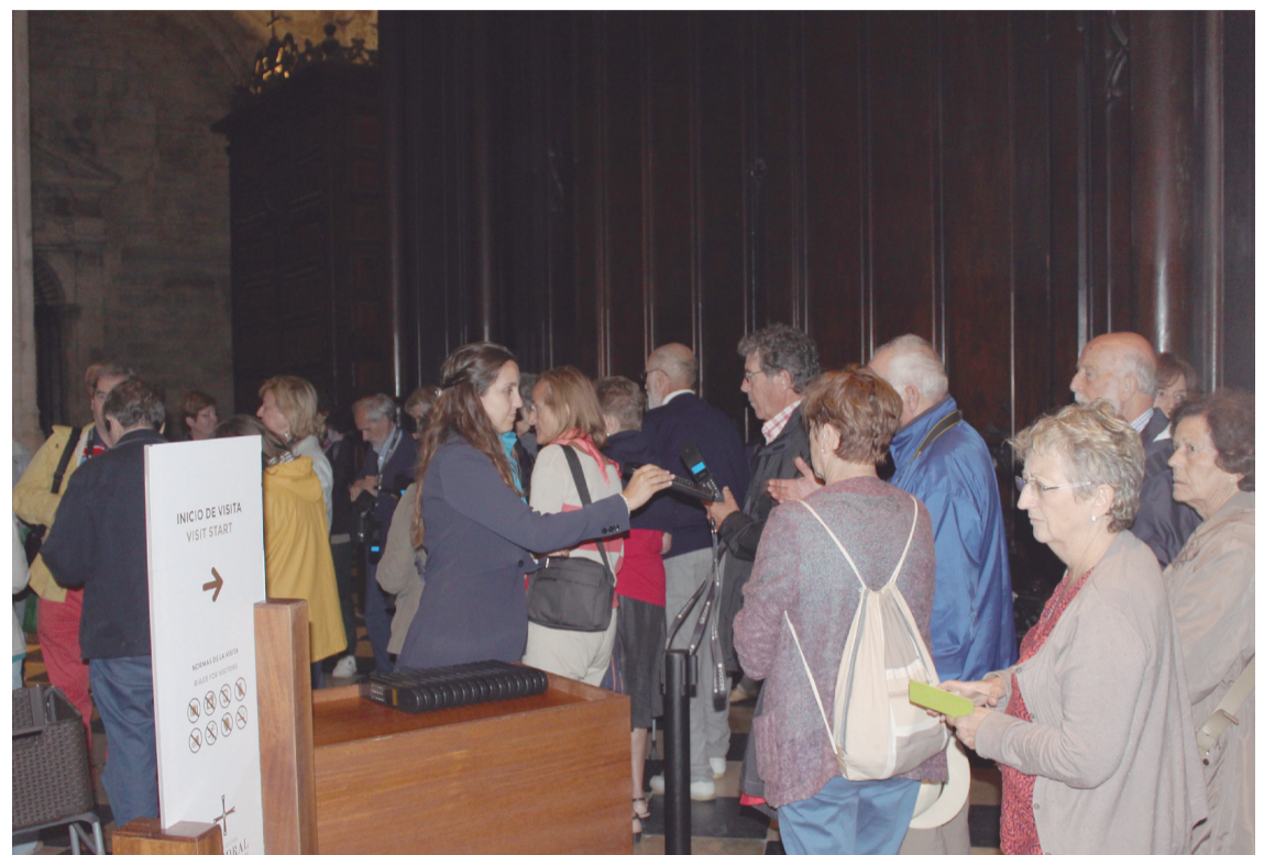
Un momento de la entrada de visitantes en la Catedral, en estos días. A la izquierda, el Carnet que se entrega para poder entrar durante todo el año.

El número de peregrinos del Camino de Santiago que recalán en la Catedral de Oviedo es otra de las cifras que ha aumentado considerablemente este verano, en comparación con años anteriores. “Desde los 10 ó 15, que eran los que llegaban aproximadamente a diario, a los 40 ó 50 que recibimos todos los días ahora”. “Son muchos más, ciertamente, pero