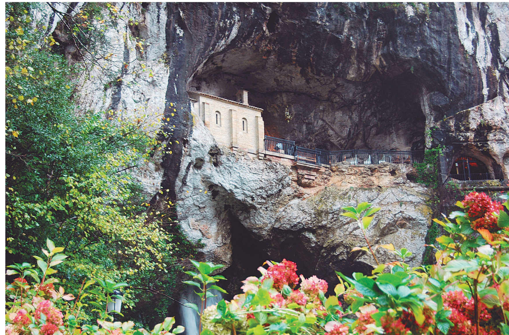
Cueva de Covadonga.

La segunda quincena de agosto vendrá marcada por el recuerdo a Juan Pablo II en su visita a Oviedo y Covadonga, que tuvo lugar los días 20 y 21 de agosto de 1989. Con este motivo el Santuario organizará una exposición con fotografías, objetos y recuerdos que hacen referencia a este momento. Un momento que también será recordado en esta próxima nove-