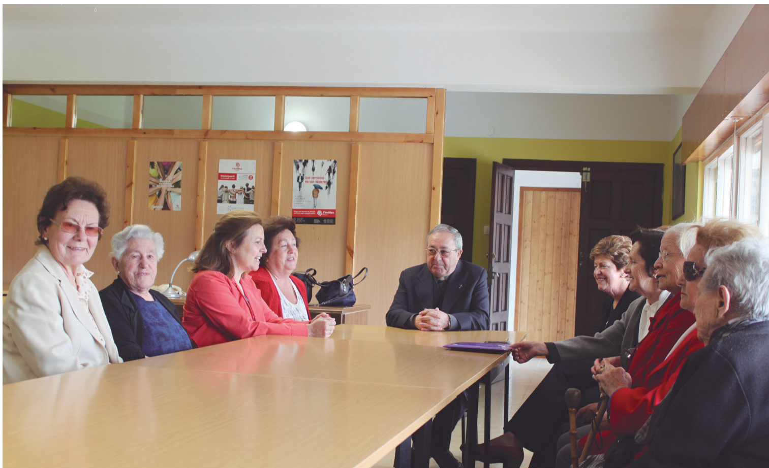
Las voluntarias de Cáritas de la UPAP de Las Luiñas, en su nueva sede de Cáritas en Novellana.