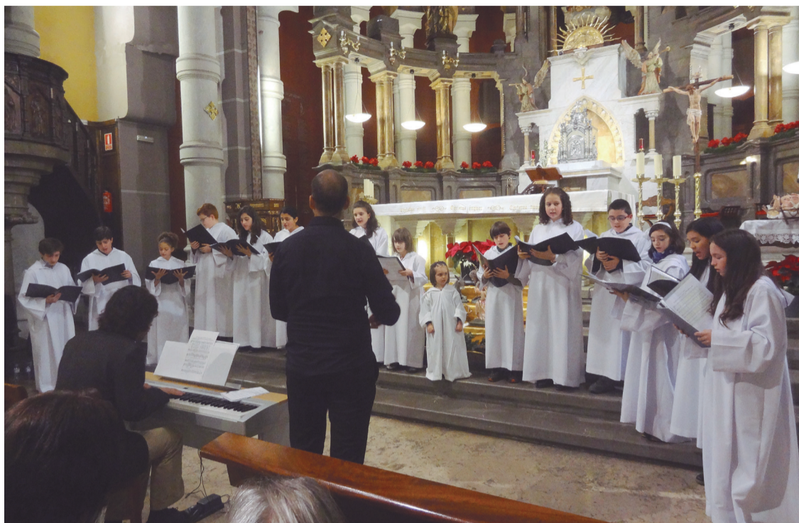
Un momento del concierto de las pasadas navidades interpretado por la Escolanía de la Basílica del Sagrado Corazón.

Se trata de una apuesta por las voces blancas que además de enriquecer las celebraciones religiosas, suponen una oportunidad para los niños de introducirse en el mundo del canto y de la música clásica. Para el director de la Escolanía de la Basílica, “los niños responden siempre muy bien. Es algo voluntario y si vienen es porque lo hacen con gusto. No es necesari-