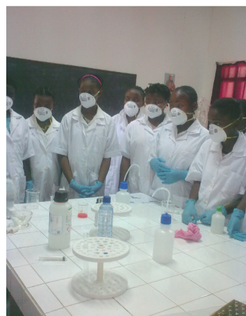
Estudiantes en el laboratorio.

Ningún camino cristiano puede agotar las distintas posibilidades que Jesús ha introducido en el mundo al proponernos vivir el Evangelio y construir su Reino con la Iglesia. Los monjes y monjas contemplativos tienen esta encomienda de acogida, de escucha, adoración e intercesión como testimonio de su modo concreto de seguimiento del Señor que nos hace tanto bien a los demás cristianos. Evangelizan siendo lo que son, evangelizan orando. Y como decía Pablo VI, ellos representan en medio de un mundo asfixiante y asfixiado por tantos motivos, una zona verde en donde la vista descansa, el aire que se respira es bondadoso y el corazón vuelve a palpar latidos de esperanza para seguir luego en la brecha de cada cual con decisión y agradecimiento.